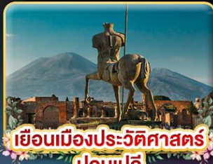
เยือนเมืองประวัติศาสตร์ ปอมเปอี