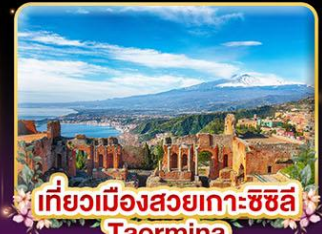
เที่ยวเมืองสวยเกาะซซิลี Taormina