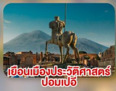
เยือนเมืองประวัติศาสตร์ ปอมเปอี