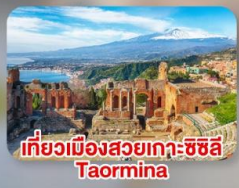
เที่ยวเมืองสวยเกาะซิซิลี Taormina