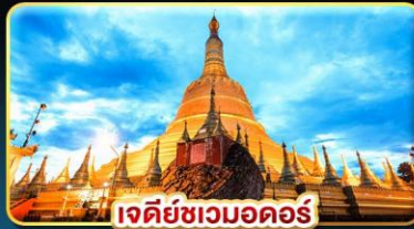
เจดีย์ชเวดากอง