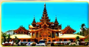
พระราชวังบุเรงนอง