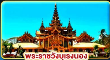
พระราชวังบุเรงนอง