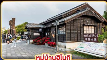
หมู่บ้านฮินกิ

"ไทเป" มแดนดรแห่งเมืองสีัน เที่ยวจุใจ เช็อินจุดไฮไลท์