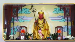
วัดพระกั๋งซำจั้ง