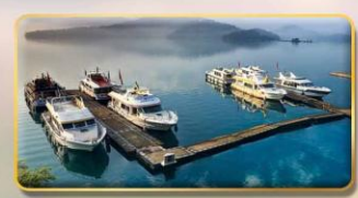
ล่องเรือชมทะเลสาบสุริยันจันทรา