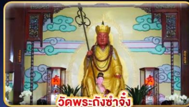
วัดพระกั๋งชาจิ