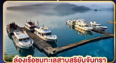
ล่องเรือชมทะเลสาบสุยอันจินทรา