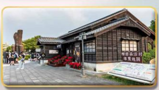
หมู่บ้านฮินโก