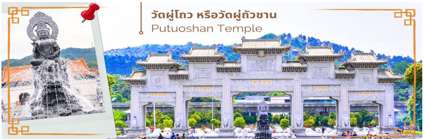
วัดผู้โถ้ว หรือวัดผู้ถัวซาน Putuoshan Temple

จากนั้นนำท่านสู่ วัดผู้โถ้ว หรือวัดผู้ถัวซาน (Putuoshan Temple) ที่ได้รับต้นแบบดินแดนอันศักดิ์สิทธิ์ จากเกาะผู้โถ้วซาน ของพระโพธิสัตว์กวนอิม พุทธศาสนิกายมหายาน พระโพธิสัตว์กวนอิมคืออวตารหนึ่งของพระอมิตาภพุทธเจ้า โดยรวมของวัดมีพื้นที่กว้างขวางและออกแบบด้วยรูปแบบสถาปัตยกรรมโบราณแบบดั้งเดิมโดยเลียนแบบวัดเก่าบนเกาะผู้โถ้วซาน โดยมีอาคารหลักๆ 3 ชั้น ด้านหน้ามีหินอ่อนแกะสลักพระโพธิสัตว์กวนอิมอยู่บนลานน้ำพุศักดิ์สิทธิ์ และมีบรรยากาศที่ร่มรื่นสงบเหมาะสำหรับพักผ่อนอีกด้วย