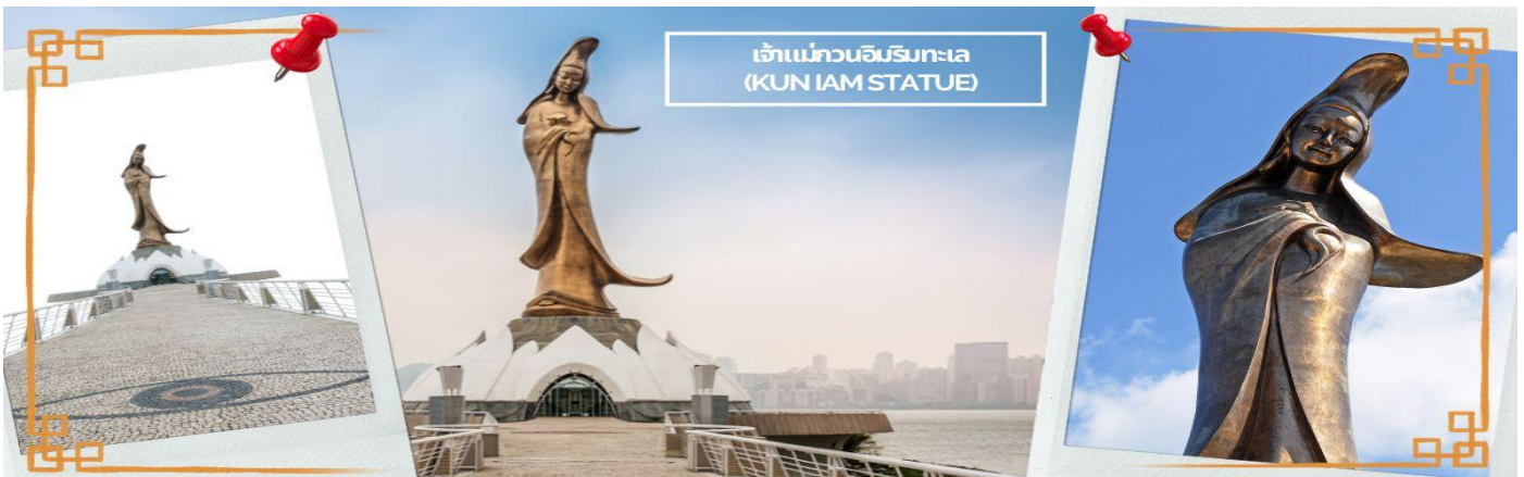
เจ้าแม่กวนอิมริมทะเล (KUN IAM STATUE)

นำท่านผ่านชม เจ้าแม่กวนอิมริมทะเล (The Statue of Kun Iam) เจ้าแม่กวนอิมปรางค์ทองสร้างด้วยทองสัมฤทธิ์ทั้งองค์ มีความสูง 18 เมตร หนักกว่า 1.8 ตัน ประดิษฐานอยู่บนฐานดอกบัวงดงามอ่อนช้อย สะท้อนกับแดดเป็นประกายเรืองรองเหลืองอร่ามงดงาม จับตา เจ้าแม่กวนอิมองค์นี้เป็นเจ้าแม่กวนอิมลูกครึ่ง คือ บั้นเป็นองค์เจ้าแม่กวนอิมแต่กลับมีพระพักตร์เป็นหน้าพระแม่มาลีที่เป็นเช่นนี้ก็เพราะว่าเป็นเจ้าแม่กวนอิมโปรดเกสตั้งใจสร้างขึ้นเพื่อเป็นอนุสรณ์ให้กับมาเก๊าในโอกาสที่ส่งมอบมาเก๊าคืนให้กับจีน