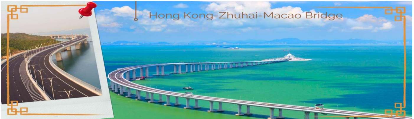
Hong Kong-Zhuhai-Macao Bridge

นำท่านผ่านชม เจ้าแม่กวนอิมริมทะเล (The Statue of Kun Iam) เจ้าแม่กวนอิมปรางค์ทองสร้างด้วยทองสัมฤทธิ์ทั้งองค์ มีความสูง 18 เมตร หนักกว่า 1.8 ตัน ประดิษฐานอยู่บนฐานดอกบัวงดงามอ่อนช้อย สะท้อนกับแดดเป็นประกายเรืองรองเหลืองอร่ามงดงาม จับตา เจ้าแม่กวนอิมองค์นี้เป็นเจ้าแม่กวนอิมลูกครึ่ง คือ บั้นเป็นองค์เจ้าแม่กวนอิมแต่กลับมีพระพักตร์เป็นหน้าพระแม่มาลีที่เป็นเช่นนี้ก็เพราะว่าเป็นเจ้าแม่กวนอิมโปรดเกสตั้งใจสร้างขึ้นเพื่อเป็นอนุสรณ์ให้กับมาเก๊าในโอกาสที่ส่งมอบมาเก๊าคืนให้กับจีน