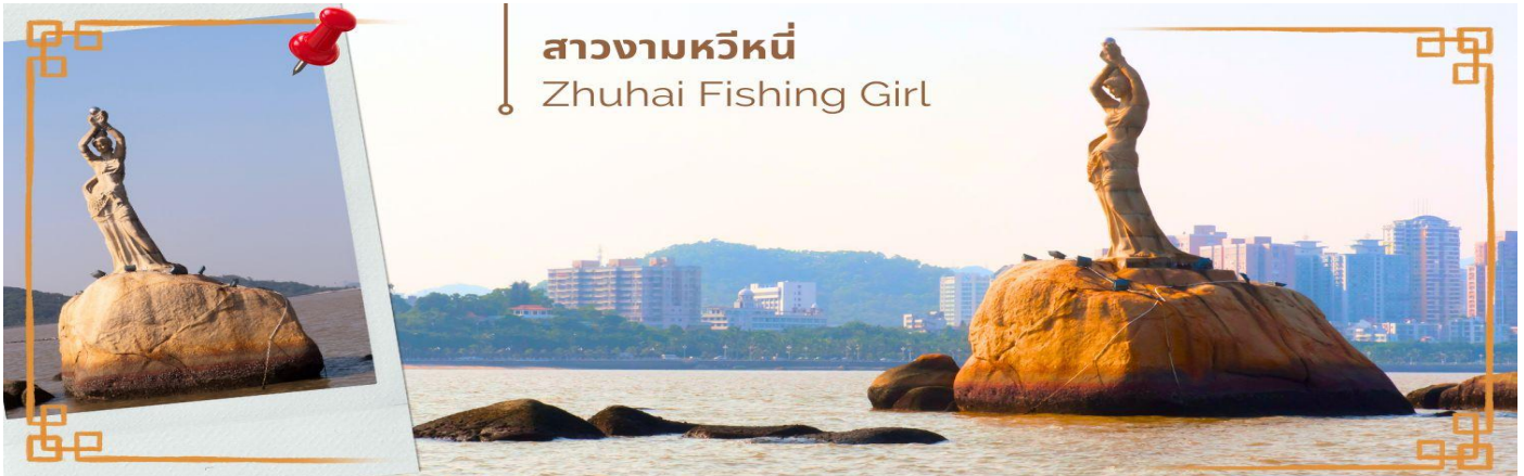
สาวงามหวิหนี่

จากนั้นนำท่านสู่ จูไห่ฟิชเชอร์เกิร์ล (Zhuhai Fishing Girl) หรือ สาวงามหวิหนี่ เป็นสถานที่ไฮไลท์ของเมืองจูไห่ ซึ่งเป็นจุดท่องเที่ยวอีกจุดที่สำคัญ ของเมืองนี้ เป็นรูปหินแกะสลักหญิงชาวประมงยืนชูไข่มุกยื่นออกไปในทะเล ดัดริม ผานถนนคูรัก และที่เรียกว่าถนนคูรักเพราะว่าภายในบริเวณถนนริมชายหาดแห่งนี้ ได้มีการนำเก้าอี้ หรือ ม้านั่ง ซึ่งทำมาสำหรับ 2 คนเท่านั้น จึงตั้งชื่อว่า ถนนคูรัก