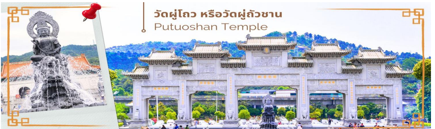
วัดผู่โถว หรือวัดผู่ถัวซาน

จากนั้นนำท่านสู่ วัดผู่โถว หรือวัดผู่ถัวซาน (Putuoshan Temple) ดินแดนอันศักดิ์สิทธิ์ ของพระโพธิสัตว์กวนอิม พุทธศาสนิกายมหายาน พระโพธิสัตว์กวนอิมคืออวตารหนึ่งของพระอมิตาภพุทธเจ้า ซึ่งพระโพธิสัตว์กวนอิม เป็นมหารุขมีวิฆเนศวรโดยรวมกว้างขวางและออกแบบด้วยรูปแบบสถาปัตยกรรมโบราณแบบดั้งเดิม ที่จำลอง มาจากเกาะผู่โถวซานลงมาสู่ดินแดนแห่งท้องทะเลใต้ แห่งนี้