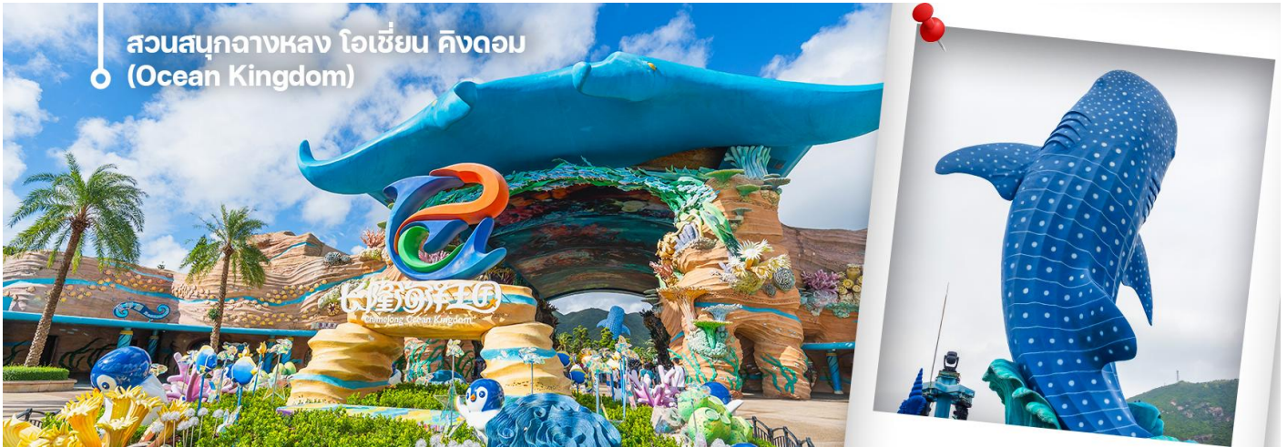
สวนสนุกฉางหลง โอเชียน คิงดอม (Ocean Kingdom)