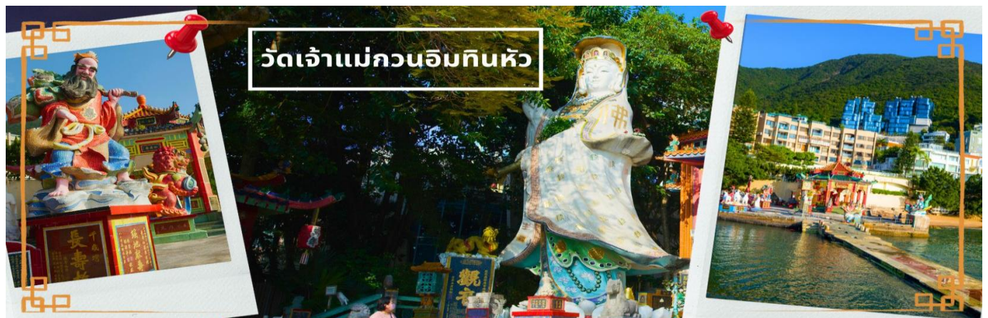
วัดเจ้าแม่กวนอิมทินหัว

เช้า ๑๐ บริการอาหารเช้า ณ ภัตตาคาร **เมนูติ่มซำต้นตำหรับฮ่องกง** (3) จากนั้นนำท่านเดินทางสู่ วัดเจ้าแม่กวนอิมทินหัว อ่าวรีพลัสเบย์ (TIN HAU TEMPLE REPULSE BAY) ตั้งอยู่ริมทะเล เป็นสถานที่ท่องเที่ยวสำคัญ สร้างขึ้นในปี ค.ศ.1993 วัดแห่งนี้ถูกสร้างขึ้นเพื่อคุ้มครองชาวประมงในการออกเรือไปหาปลา ซึ่งเป็นหนึ่งในวัดที่เก่าแก่ที่สุดของฮ่องกง บริเวณวัดจะมีเจ้าแม่กวนอิมองค์ใหญ่ ปรากฏประทานพรตั้งอยู่ เป็นเทพที่ชาวฮ่องกงและคนจีนให้ความเคารพนับถือมากที่สุด สามารถขอพรได้ทุกเรื่อง วัดนี้เป็นที่นิยมมีนักท่องเที่ยวเดินทางมาขอพรกันมากมาย เพราะเชื่อในความศักดิ์สิทธิ์