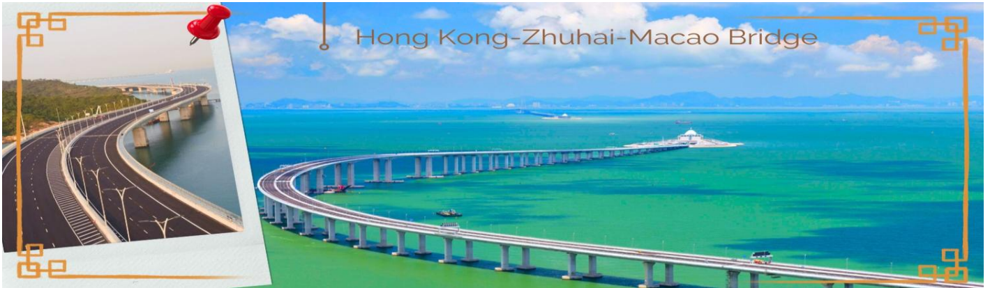
Hong Kong-Zhuhai-Macao Bridge

นำท่านเดินทางสู่ วัดเจ้าแม่กวนอิม มาเก๊า (Kun Iam Temple) เป็นหนึ่งในสามวัดเก่าแก่ที่สุดของมาเก๊า ถูกสร้างขึ้นระหว่างการครองราชย์ของจักรพรรดิว่านลี่ ในสมัยราชวงศ์หมิง ภายในเป็นที่ประดิษฐานของเทพเจ้าหลายองค์ รวมถึงองค์ที่มีชื่อเสียง นั่นก็คือ เจ้าแม่กวนอิม ซึ่งไม่เหมือนที่ไหน ด้วยการแต่งเครื่องทรงชุดเจ้าสาวโบราณอย่างสวยงาม ผู้คนนิยมมาไหว้ขอพรให้มีความสงบสุขและโชคดี รวมถึงการทำพิธีศักดิ์สิทธิ์เสริมสิริมงคลเรื่องเงินทอง สำหรับพิธีศักดิ์สิทธิ์ที่เรียกว่า "วันเปิดทรัพย์" เป็นพิธียิ่งใหญ่ประจำปีที่จะประกอบ พิธียืมเงินเจ้าแม่กวนอิม ซึ่งในหนึ่งปีจะมีฤกษ์ดีเพียงปีละครั้งเท่านั้น แต่ละปีอาจจะวันที่ไม่ตรงกัน โดยจะมีการคำนวณจากวันเวลาตามปฏิทินจีน ปกติแล้วฤกษ์ดีของการทำพิธีจะนับจากหลังวันชิวอิก หรือตรุษจีน ไป 26 วัน