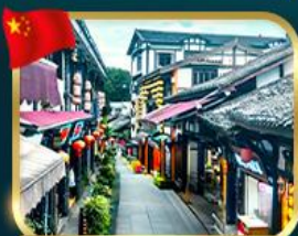
หมู่บ้านโบราณฉือซีฮั่ว

เที่ยวอุทยานหลุมฟ้าสะพานสวรรค์ + ซานนางฟ้า