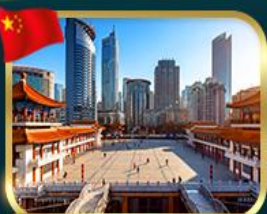
เขื่อนตึกไท่โก่วซิงโหล