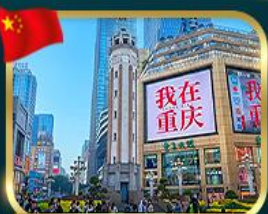
ถนนคนเดินเจียงฟางเป่ย์