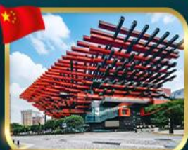
แลนด์มาร์กจิ้ง ตึกตะเกียบ