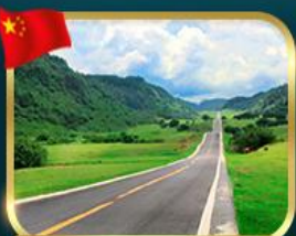
ชมวิวกุยกานซานนางฟ้า