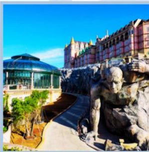
โซอ Eclipse Square