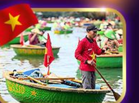
เรือกระด้ง หมู่บ้านกิมกาน