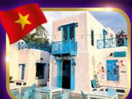
คาเฟ่สุดชิค ซานทรา มาริน่า