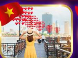
เช็กอินสะพานแห่งความรัก