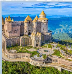
ปราสาทจันทร์