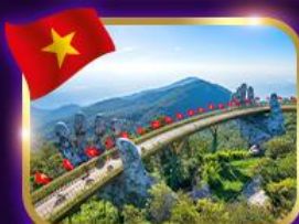
สะพานมือสีทอง บานาฮิลล์