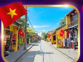
เมืองท่ามรดกโลก ฮอยอัน