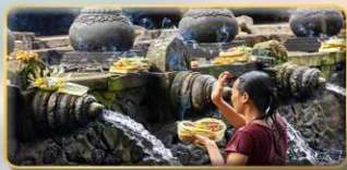
วัดน้ำพุศักดิ์สิทธิ์