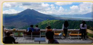
หมู่บ้านคินตามณี