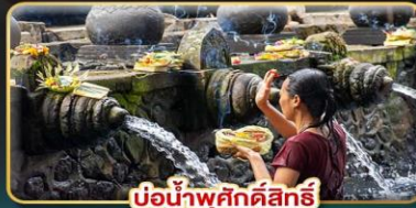
บ่อน้ำพุศักดิ์สิทธิ์