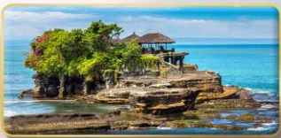
วิหารกานาห์ลอค