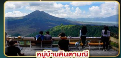
หมู่บ้านคินตามณี