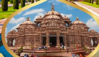
วิหารอักซาร์ดัม