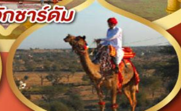
ฟรี ขี่อูฐ เมืองมันทวา ราคาเริ่มต้น