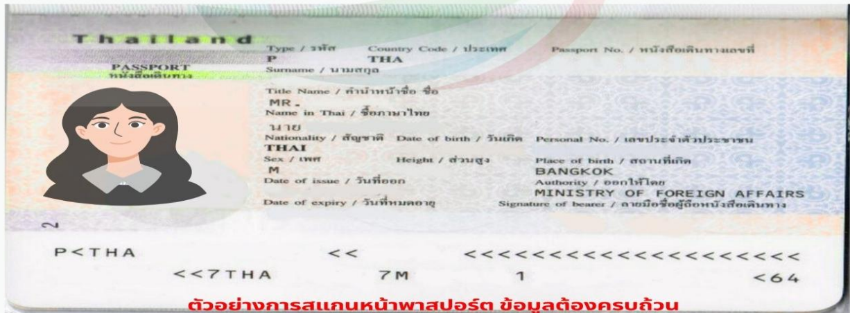
ตัวอย่างการสแกนหน้าพาสปอร์ต ข้อมูลต้องครบถ้วน ท่านสามารถสแกนส่งไฟล์ PDF หรือถ่ายรูปส่งแทนได้ ( รูปไม่เอียง ไม่ติดนิ้ว)

การพิจารณาวีซ่าเป็นดุลยพินิจของทางสถานทูตเท่านั้น ทางบริษัทเป็นผู้ดำเนินการเรื่องเอกสารและอำนวยความสะดวก ซึ่งสามารถกรอกออนไลน์ได้ก่อนเดินทาง 30 วัน หรือหลังจากท่านชำระเงินงวดสุดท้าย ทั้งนี้หลังจากกรอกข้อมูลเข้าระบบแล้วใช้เวลาพิจารณา 7-15 วันทำการ กรณีวีซ่าท่านล่าช้าหรือถูกปฏิเสธและมีค่าใช้จ่ายเพิ่มเติม ทางบริษัทขอสงวนสิทธิ์เก็บตามค่าใช้จ่ายที่เกิดขึ้นจริง