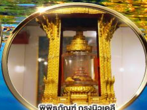
พิพิธภัณฑ์ กรุงนิวเดลี ถรณ์บนมัสการพระบรมสารีริกธาตุ