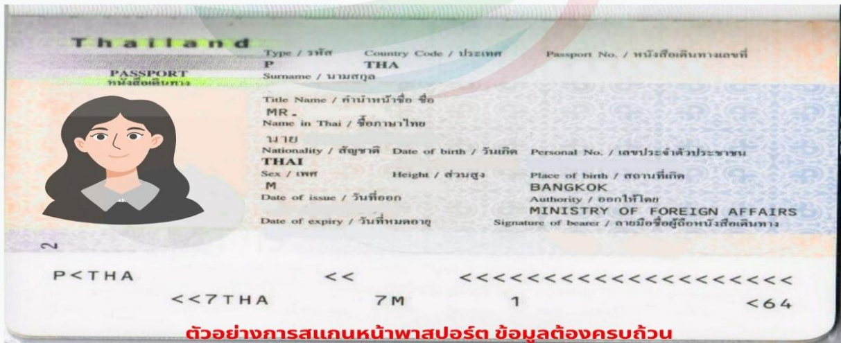
ตัวอย่างการสแกนหน้าพาสปอร์ต ข้อมูลต้องครบถ้วน ท่านสามารถสแกนส่งไฟล์ PDF หรือถ่ายรูปส่งแทนได้ ( รูปไม่เอียง ไม่ติดนิ้ว)

การพิจารณาวีซ่าเป็นดุลยพินิจของทางสถานทูตเท่านั้น ทางบริษัทเป็นผู้ดำเนินการเรื่องเอกสารและอำนวยความสะดวก ซึ่งสามารถกรอกออนไลน์ได้ก่อนเดินทาง 30 วัน หรือหลังจากท่านชำระเงินงวดสุดท้าย ทั้งนี้หลังจากกรอกข้อมูลเข้าระบบแล้วใช้เวลาพิจารณา 7-15 วันทำการ กรณีวีซ่าท่านล่าช้าหรือถูกปฏิเสธและมีค่าใช้จ่ายเพิ่มเติม ทางบริษัทขอสงวนสิทธิ์เก็บตามค่าใช้จ่ายที่เกิดขึ้นจริง