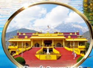
ดาริมซาล่า "ธรรมศาลา" ตำหนักองค์ดาไลลามะ