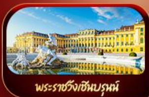
พระราชวังเซินบรูน์