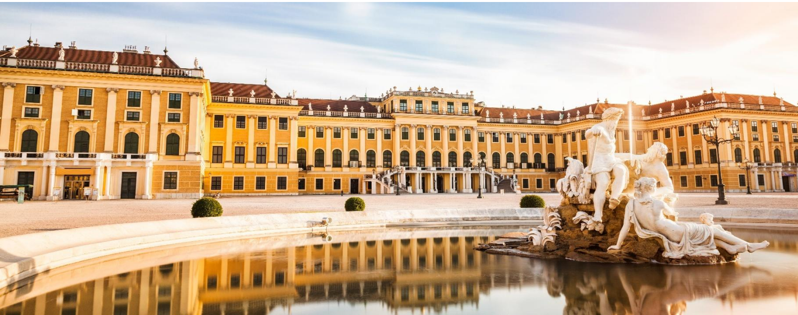
จุดเช็คอิน (ด้านนอก) ที่สายประวัติศาสตร์ต้องหลงรัก พระราชวังฮอฟบวร์ก (Hofburg Palace)

e-mail : tour.aaj@gmail.com, Website : www.allabout-journey.com