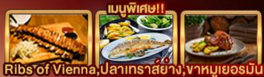
Ribs of Vienna, ปลาเทราสย่าง, จาหุมเยอร์มิน

สวางกรุง กรุง ไฮไลซ์ทุกจุด/เซตอิง Germany Austria Prague Slovakia Hungary Zugspitze Munich Salzburg Hallstatt Bratislava