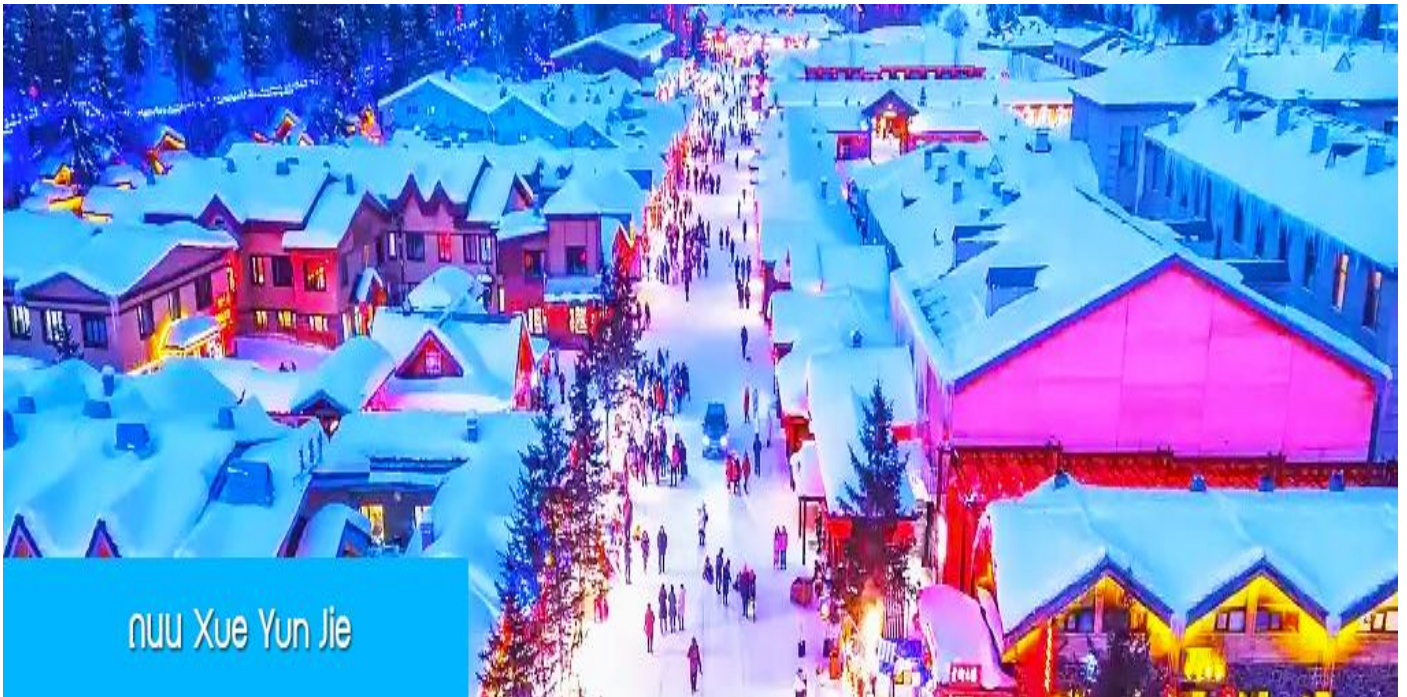
ถนน Xue Yun Jie