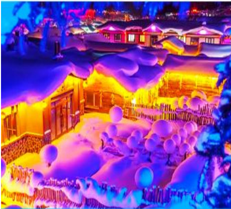
หมู่บ้านหิมะ Snow Town

e-mail : tour.aaj@gmail.com, Website : www.allabout-journey.com