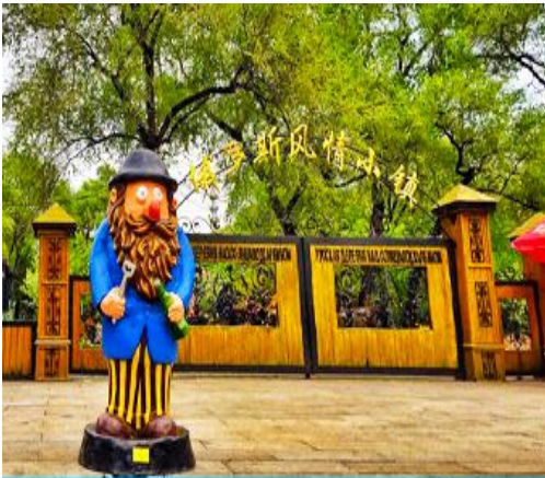
หมู่บ้านรัสเซีย