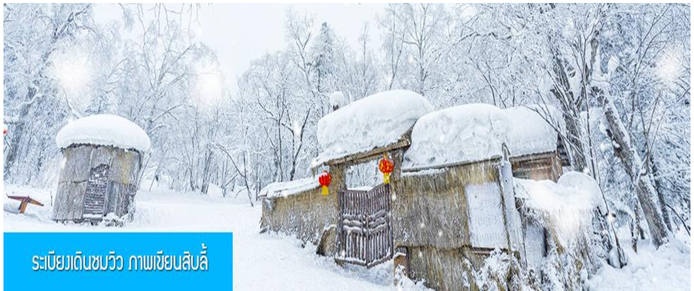
ระเบียบเดินชมวิว ภาพเขียนสีปลิว