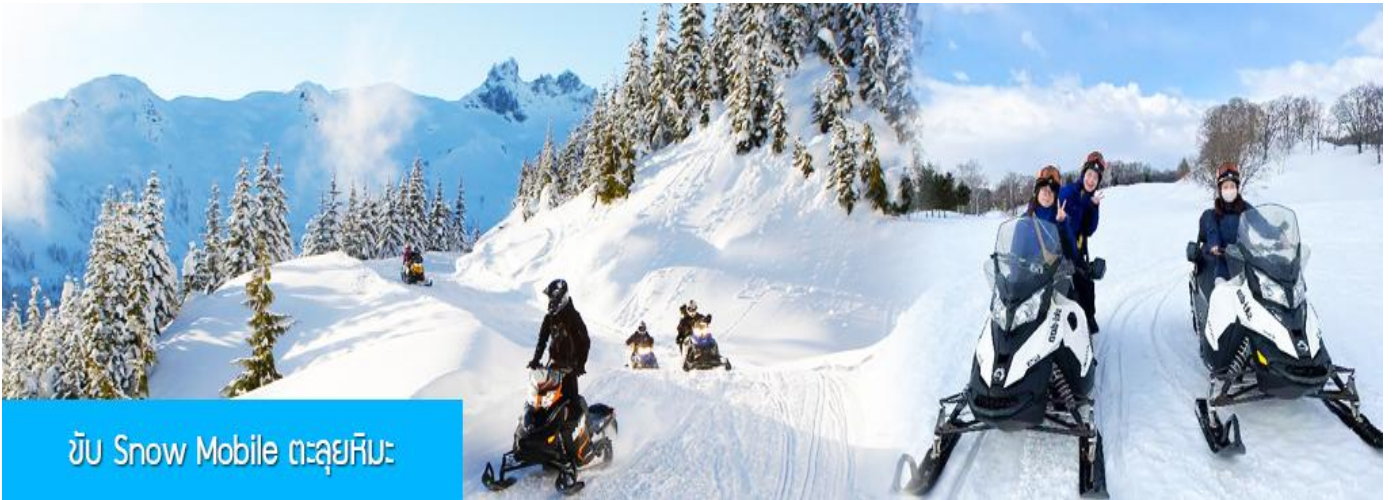
ขับ Snow Mobile ตะลุยหิมะ

e-mail : tour.aaj@gmail.com, Website : www.allabout-journey.com