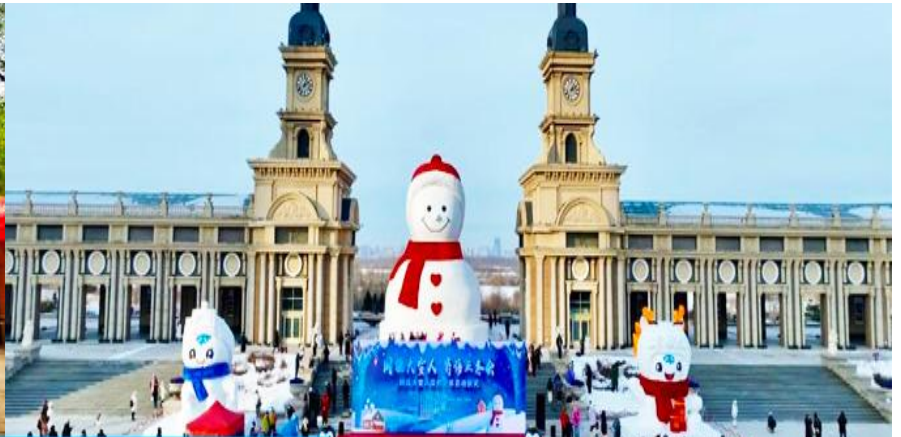
ตึกดาหิมะยักษ์

เที่ยง รับประทานอาหารกลางวัน ณ ภัตตาคาร (11)