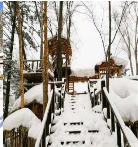
ระบิยชมวิวปี้งุยซาบ