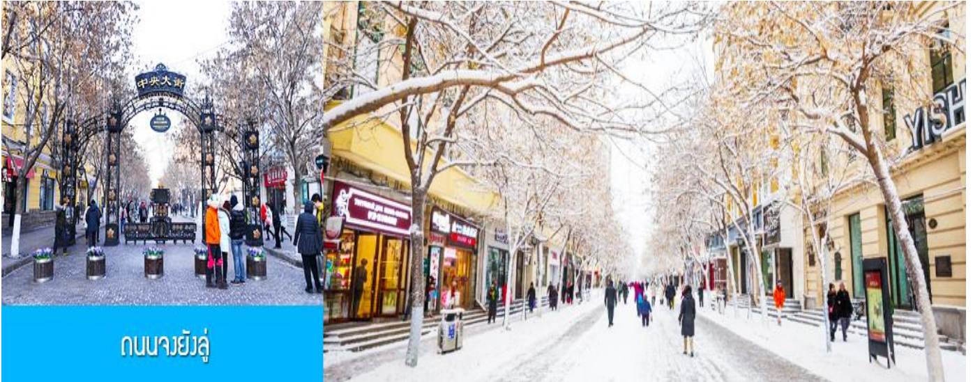
ถนนมายังลู

e-mail : tour.aaj@gmail.com, Website : www.allabout-journey.com