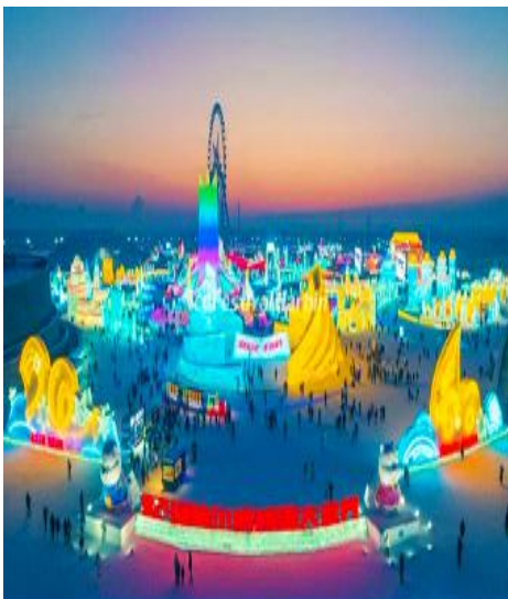
เทศกาลแกะสลักน้ำแข็งนานาชาติ

หลังอาหารนำท่านเดินทางโดยรถบัสสู่ เมืองฮาร์บิน ใช้ทางด่วนมอเตอร์เวย์กลับเข้าสู่ตัวเมืองฮาร์บิน