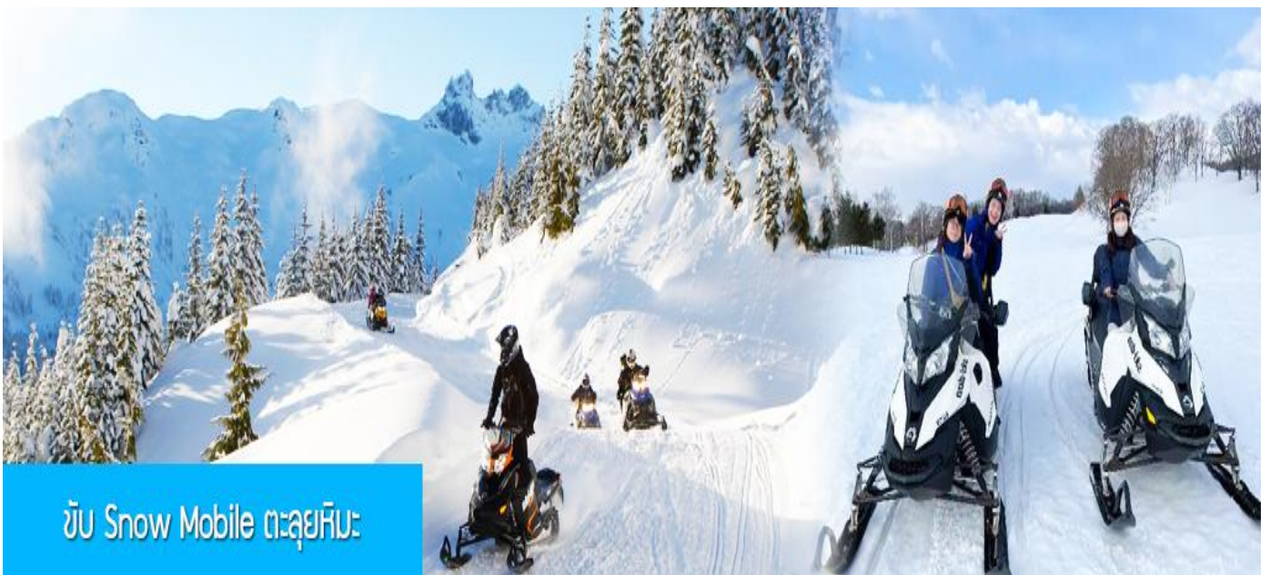
ขับ Snow Mobile ตะลุยหิมะ

รายการที่ 1 ระเบียบเดินชมวิว ภาพเขียนสิบลี้ 冰雪十里画廊 เป็นการเดินชมวิวธรรมชาติตามเนินเขา ท่ามกลางแนวป่าที่มีต้นไม้ที่มีน้ำแข็งเกาะอยู่ตามกิ่งไม้ เป็นภาพวิวธรรมชาติฤดูหนาวที่สวยงามน่าประทับใจและพบได้เฉพาะในฤดูหนาวทางภาคอีสานของจีนเท่านั้น เวลาที่ใช้สำหรับโปรแกรมเสริมนี้ประมาณ 1 ชั่วโมง อัตราค่าบริการ ท่านละ 260 หยวน หรือ 1300 บาท อัตรานี้รวมค่าบริการผ่านเข้าอุทยาน ค่ารถรับ ส่ง และค่าบริการของไกด์ท้องถิ่น และค่าบริการจัดการของบริษัททัวร์ท้องถิ่น หมายเหตุ โปรแกรมเสริมเป็นโปรแกรมที่ท่านต้องเสียค่าใช้จ่ายเองด้วยความสมัครใจ สำหรับท่านที่ไม่เข้าร่วมกิจกรรมดังกล่าวสามารถนั่งพักในรถได้