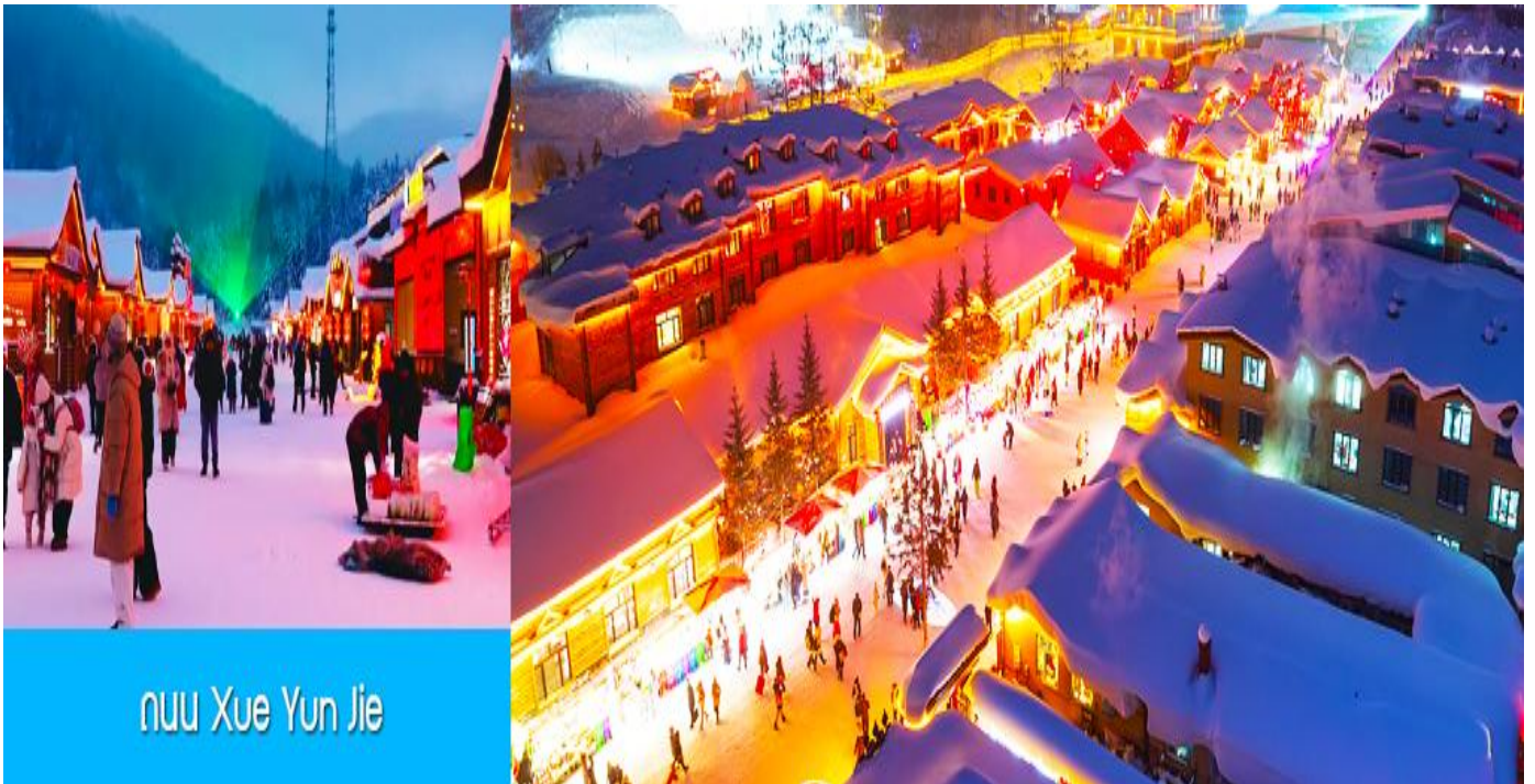
ถนน Xue Yun Jie

นำท่านสู่ ระเบียงชมวิวับึงจยซาน 棒槌山观光栈道 เป็นระเบียงทางเดินชมวิวหมู่บ้านหิมะบนเนินที่ ทำด้วยไม้ มีความยาว 3,200 เมตร ระเบียงทางเดินชมวิวนี้ได้พาดผ่านจุดชมวิวสวยงาม ต่าง ๆ ที่ สามารถมองเห็นทัศนียภาพที่สวยงามของเมืองในเทพนิยายในมิติและมุมมองที่หลากหลาย เป็นที่นิยม ของนักท่องเที่ยวที่ชื่นชอบการถ่ายภาพเป็นอย่างมาก เพราะระเบียงทางเดินชมวิวมีมุมสวย ๆ ให้ถ่ายรูป ตลอดเส้นทาง, เดินบนระเบียงไม้มีค่าใช้จ่ายใด ๆ ท่านสามารถเดินชมวิวได้ตามอัธยาศัย จน ฉิมใจ