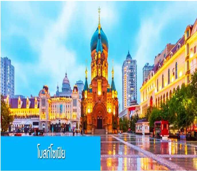
โบสถ์โซเฟีย

e-mail : tour.aaj@gmail.com, Website : www.allabout-journey.com