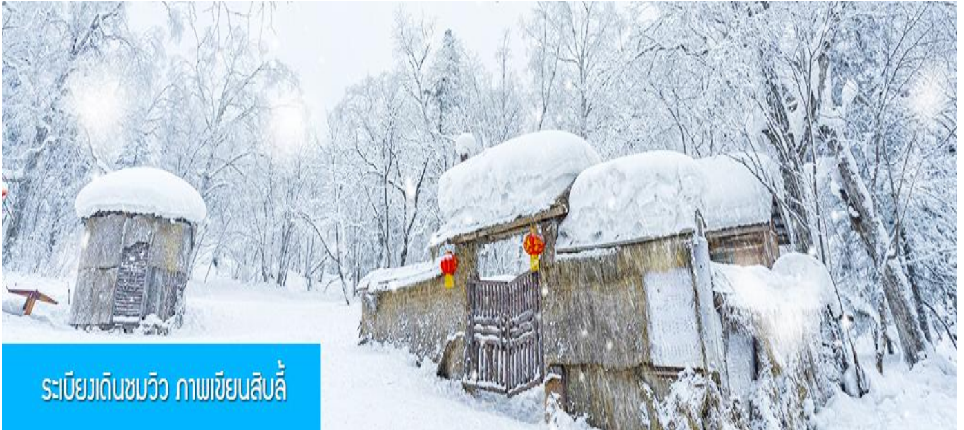
ระเบียบเดินชมวิว ภาพเขียนสิบลี้

e-mail : tour.aaj@gmail.com, Website : www.allabout-journey.com