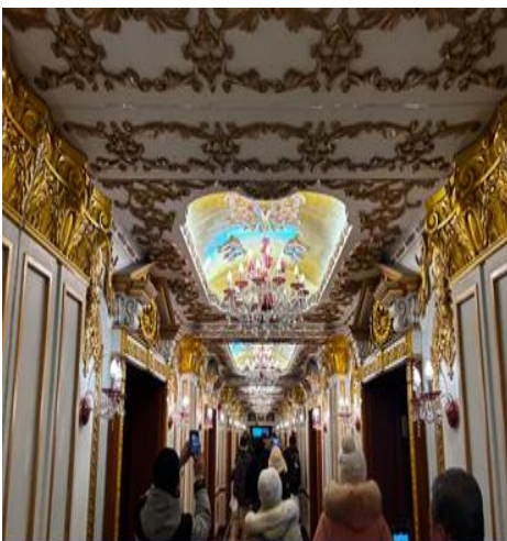
ตึกเกสซกรรมฮาร์บิน

จากนั้นนำท่านเที่ยวชม ถนนจงยังลู 中央大街 ถนนสายหลักของเมืองฮาร์บิน ถนนที่เต็มไปด้วย อาคารบ้านเรือนที่เป็นสถาปัตยกรรมตะวันตกที่สร้างในช่วงคริสต์ศตวรรษที่ 18 – 19 ที่เมืองนี้ถูกแก ครองโดยรัสเซีย อีกทั้งเป็นถนนคนเดินที่เป็นแหล่งรวมร้านค้าสินค้าแบรนด์เนมทั้งในและต่างประเทศ ร้านจำหน่ายของที่ระลึกและสินค้าพื้นเมือง ร้านอาหารพื้นเมืองต่าง ๆ มากมาย ให้ท่านมีเวลาอิสระเดิน เที่ยวและช้อปปิ้ง หรือลิ้มรสอาหารพื้นเมืองตามอัธยาศัย.. **ให้ท่านลิ้มรสไอศกรีมชื่อดังเก่าแก่ ของเมืองฮาร์บินท่านละ 1 ท่านฟรี