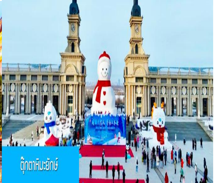
ตุ๊กตาสหิมะยักษ์

วันที่สอง ฮาร์บิน-ซื้ออุปกรณ์กันหนาวที่ตึกแมนฮัตตัน-โบสถ์เซนต์โซเฟีย (ถ่ายรูปด้านนอก)-อนุสาวรีย์ฝิ่งหง-ถนนจงย้ง-โรงงานเภสัชกรรมฮาร์บิน-ตุ๊กตาสหิมะยักษ์