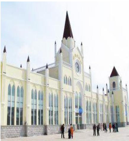
สถานีรถไฟยูลี

เดินทางใบใหญ่เข้าสู่ที่พักในหมู่บ้านอาจสร้างความไม่สะดวกแก่ท่าน จึงไม่แนะนำ