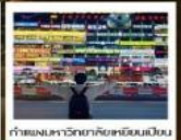
อุทยานดางโป๊ซัน