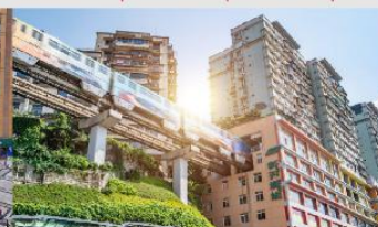
รถไฟทะเลตึก