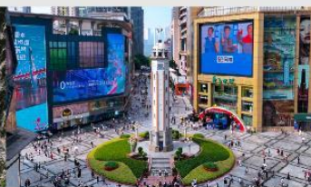
ถนนเจี๋ยฟางเป่ย์