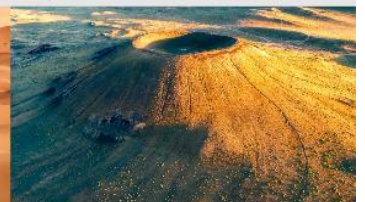
ภูเขาไฟอูลันฮาตา

*ทางบริษัทฯ ขอสงวนสิทธิ์ในการสลับโปรแกรมทัวร์ตามความเหมาะสมขึ้นอยู่กับสถานการณ์หน้างาน โดยคำนึงถึงผลประโยชน์ของลูกค้าเป็นสำคัญ