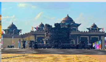
ศูนย์วัฒนธรรมหยวนหยิว