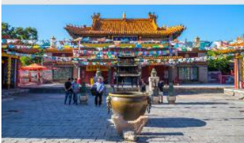
วัดต้าเจา