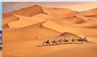
ทะเลทรายเสียงชาวน