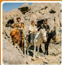
ชาวมองโกล