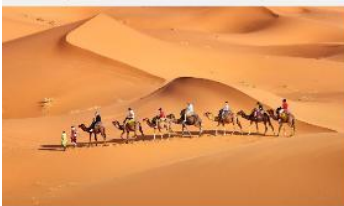
ชีอูฐชมทะเลทราย