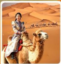
ซิวจู่ชมทะเลทราย

● ไอลี่ เป็นทราseyเสียงชาวน แผล่งท่องเที่ยวระดับ 5A ของจีน แกรนด์แคนยอนแม่น้ำเหลือง ซิวจู่ก่ามกลางทะเลทราย