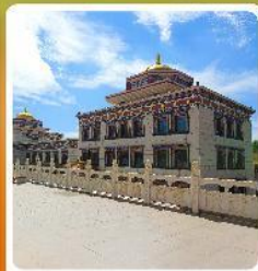
ทำเนียบพระลามะจุหลาน