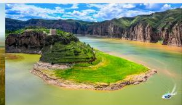
แกรนด์แคนยอนแม่น้ำเหลือง

*ทางบริษัทฯ ขอสงวนสิทธิ์ในการสลับโปรแกรมทัวร์ตามความเหมาะสมขึ้นอยู่กับสถานการณ์หน้างาน โดยคำนึงถึงผลประโยชน์ของลูกค้าเป็นสำคัญ