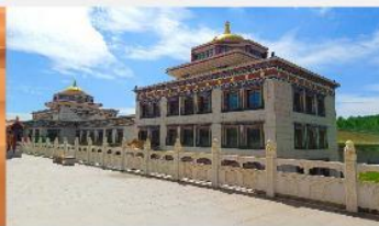
ทำเนียบพระลามะอุหลาน