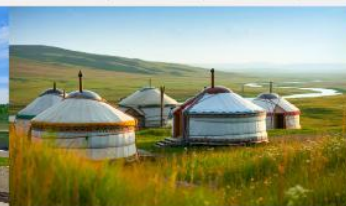
ทุ่งหญ้าออร์ดอส