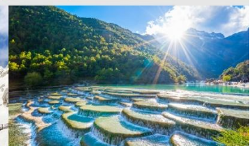
ทะเลสาบไป๋สยู่เหอ

*ทางบริษัทฯ ขอสงวนสิทธิ์ในการสลับโปรแกรมทัวร์ตามความเหมาะสมขึ้นอยู่กับสถานการณ์หน้างาน โดยคำนึงถึงผลประโยชน์ของลูกค้าเป็นสำคัญ