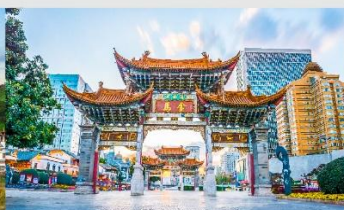
ประตูม้าทองไถ่หยก