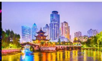
หอเจียเซี่ยวโหลว