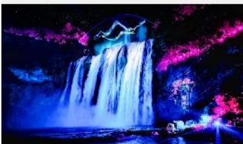
อุทยานน้ำตกหวงกั๋วซู่