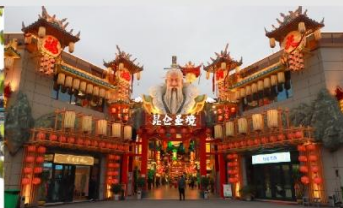
เมืองจำลองวัฒนธรรมคุนหลุน