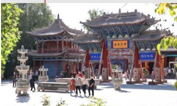
วัดพระใหญ่จางเย่