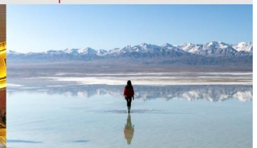
ทะเลสาบซิงไห่

*ทางบริษัทฯ ขอสงวนสิทธิ์ในการสลับโปรแกรมทัวร์ตามความเหมาะสมขึ้นอยู่กับสถานการณ์หน้างาน โดยคำนึงถึงผลประโยชน์ของลูกค้าเป็นสำคัญ