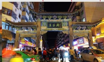
ตลาดกลางคืนถนนม่อเจีย