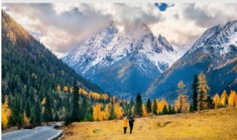
ภูเขาสี่ดรุณี (หุบเขาชวงเฉียวโกว)