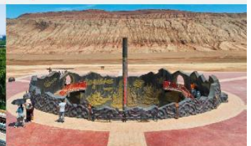
ภูเขาเปลวเพลิง

*ทางบริษัทฯ ขอสงวนสิทธิ์ในการสลับโปรแกรมทัวร์ตามความเหมาะสมขึ้นอยู่กับสถานการณ์หน้างาน โดยคำนึงถึงผลประโยชน์ของลูกค้าเป็นสำคัญ