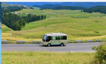
ทุ่งหญ้าเจียนปูลาเค่อ