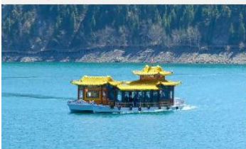
ล่องเรือทะเลสาบเกียนฉิว