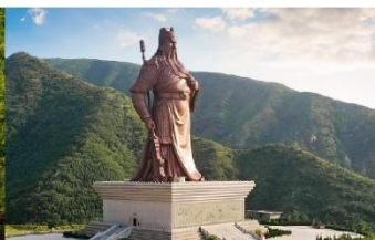
บ้านเกิดท่านกวนอู