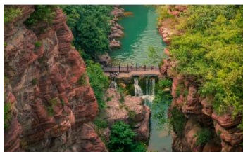
อุทยานสวรรค์หยุนโถซาน