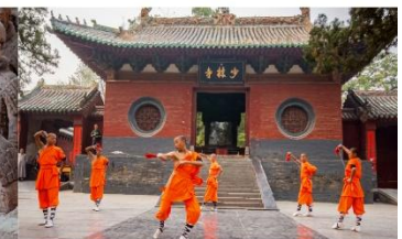
ชมโชว์กังฟูเล่าหลิน

*ทางบริษัทฯ ขอสงวนสิทธิ์ในการสลับโปรแกรมทัวร์ตามความเหมาะสมขึ้นอยู่กับสถานการณ์หน้างาน โดยคำนึงถึงผลประโยชน์ของลูกค้าเป็นสำคัญ