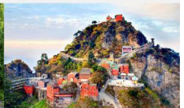
อุทยานเขาวู้ต้ง

*ทางบริษัทฯ ขอสงวนสิทธิ์ในการสลับโปรแกรมทัวร์ตามความเหมาะสมขึ้นอยู่กับสถานการณ์หน้างาน โดยคำนึงถึงผลประโยชน์ของลูกค้าเป็นสำคัญ