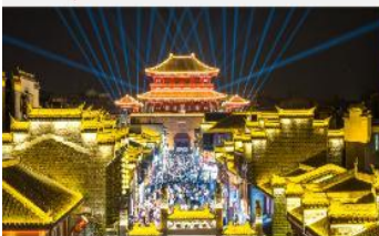
เมืองโบราณเซียงหยาง