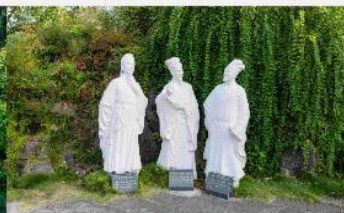
สวนต้าสามสหาย