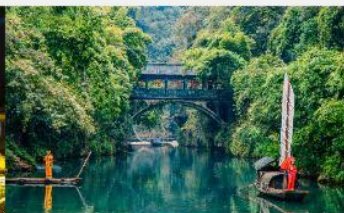
หมู่บ้านซานเสีเหรินเจีย