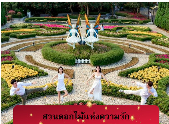
สวนดอกไม้แห่งความรัก

นำท่านชม สักการะพระพุทธรูปหินอึ้ง เป็นพระพุทธรูปหินองค์ใหญ่ตั้งตระหง่านบนยอดเขาแห่งนี้ ให้ท่านได้ ขอพรเพื่อความเป็นมงคล นำท่านชม ป๊อปมาร์ท เป็นร้านค้าของเล่นเปิดใหม่ล่าสุดที่อยู่บนยอดเขานานาฮิลล์ มี สินค้าของเล่นสำหรับนักสะสมมากมายให้ท่านได้เลือกชมกับตัวละครน่ารัก อาทิเช่น Molly, SkullPanda, Labubu หมายเหตุ: การจัดการ และข้อกำหนดในการเข้าชมสินค้าอยู่นอกเหนือการจัดการของบริษัททัวร์