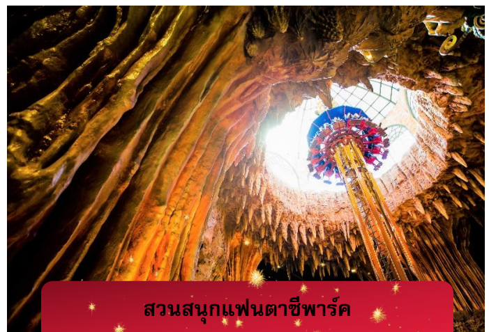
สวนสนุกแฟนตาซีพาร์ค

อิสระท่านท่องเที่ยว สวนสนุกแฟนตาซีพาร์ค ซึ่งมีเครื่องเล่นหลากหลายรูปแบบ เช่น ทำทาย ความมันส์ของหนัง 4D ระทึกขวัญกับบ้านผีสิง เกมส์สนุกๆ เครื่องเล่นเบาๆ รถบั๊ม หรือจะเลือกช อปโป๊ของที่ระลึกของสวนสนุก และ จัดร์สแห่ง ดวงดาว เปรียบเสมือนการเดินทางสู่อาณาจักร แห่งดวงดาวที่มีเส้นทางเชื่อมต่อระหว่าง