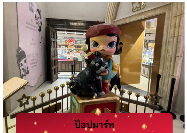
ป๊อปมาร์ท

รับจัดกรุ๊ปเหมา ท่องเที่ยว สัมมนา ดูนาน ต่างประเทศทั่วโลก