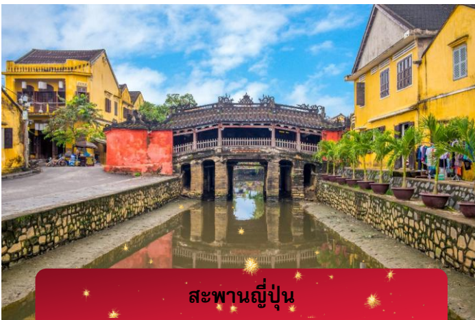
สะพานญี่ปุ่น