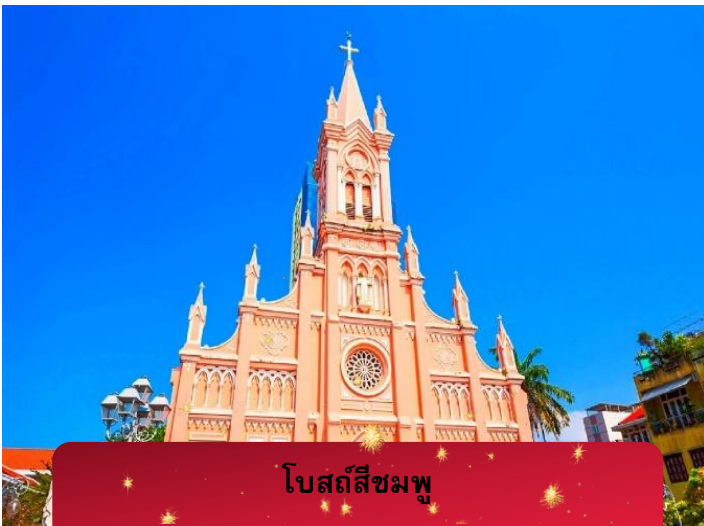
โบสถ์สีชมพู

นำท่านชม ดานัง ชาร์มมิ่งโชว์ (Danang Charming Show) การแสดงวัฒนธรรมสุดตระการตา ที่ถ่ายทอดเสน่ห์เวียดนามผ่านชุดพื้นเมือง ดนตรี และการเต้นสุดประทับใจบนเวทีระดับโลก แสง สี เสียงครบทุกอารมณ์ ชมแล้วประทับใจไม่รู้ลืม