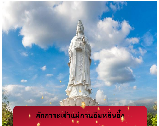
สักการะเจ้าแม่กวนอิมหลินอึ้ง

ค่า บริการอาหารค่ำ ณ ภัตตาคาร พิเศษ ... เมนูฟเฟิ่งย่าง