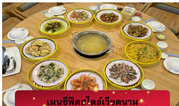
เมนูซีฟู้ดสไตล์เวียดนาม

17.05 เดินทางถึง สนามบินสุวรรณภูมิ โดยสวัสดิภาพ ... พร้อมความประทับใจ