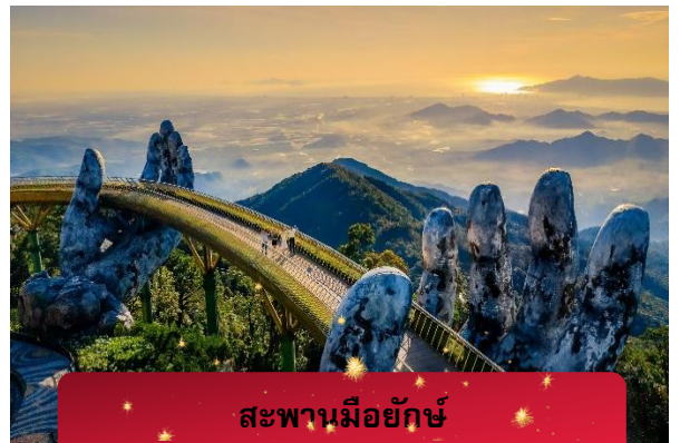
สะพานมอญักษ์

นำท่านชม สวนดอกไม้แห่งความรัก เป็นสวนดอกไม้ สไตล์ฝรั่งเศส ที่มีดอกไม้หลากหลายพันธุ์ถูกจัดเป็น สัดส่วนอย่างสวยงามท่ามกลางอากาศที่แสนเย็นสบาย