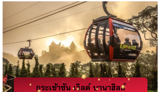
กระเช้าชั้น เวิลด์ บานาฮิลล์

มาสดดระการตามนกระเช้าลอยฟ้าที่ยาวที่สุดในโลก (5,810 เมตร) ใช้เวลาประมาณ 15 นาทีจากสถานีสู่ French Hill