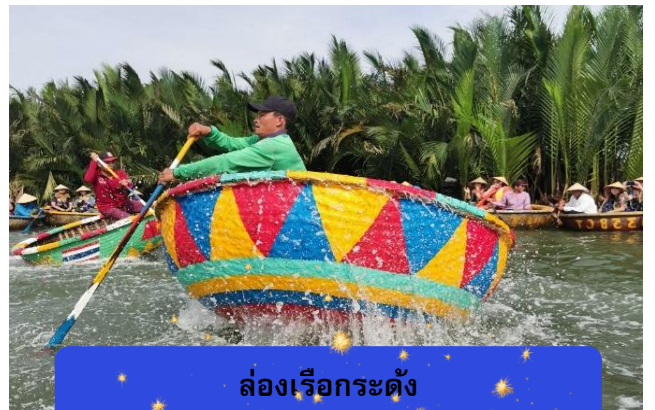
ล่องเรือกระดง

นำท่านเดินทางสู่ หมู่บ้านกัมทาน เพื่อนำท่าน ล่องเรือ กระดง หมู่บ้านเล็กๆในเมืองฮอยอันตั้งอยู่ในสวน มะพร้าวริมแม่น้ำ ในอดีตช่วงสงครามหมู่บ้านแห่งนี้เคย เป็นที่พักอาศัยของทหาร อาชีพหลักของคนที่นี่หมู่บ้าน แห่งนี้คือประมง ระหว่างการล่องเรือท่านจะได้ชม วัฒนธรรมของชาวบ้าน ณ หมู่บ้านแห่งนี้ สามารถให้ทิป ได้ตามความพอใจของท่าน