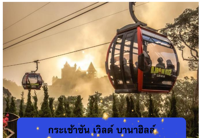
กระเช้าขึ้น เวิลด์ บานาฮิลล์

รับจัดกรุ๊ปเหมา ท่องเที่ยว สัมมนา ดูนาน ต่างประเทศทั่วโลก