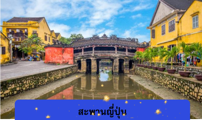
สะพานญี่ปุ่น

e-mail : tour.aaj@gmail.com, Website : www.allabout-journey.com