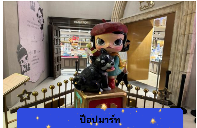
ป๊อปมาร์ท

รับจัดกรุ๊ปเหมา ท่องเที่ยว สัมมนา ดูนาน ต่างประเทศทั่วโลก