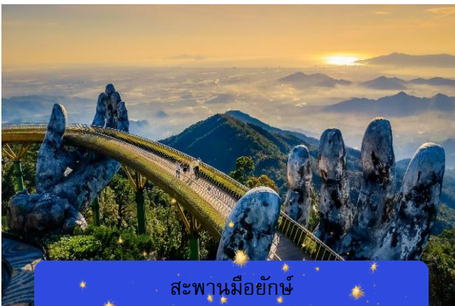
สะพานม็อยักษ์

เที่ยง รับประทานอาหารกลางวันเพื่อความสะดวกในการท่องเที่ยว