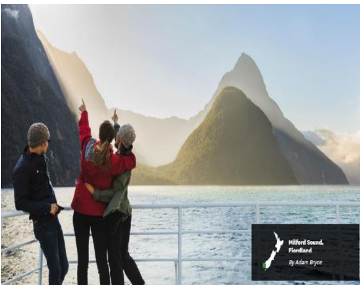
Milford Sound, Fiordland By Adam Bryce

ให้ท่านสัมผัสกับความงามของธรรมชาติโดยรอบ ซึ่งเกิดจากจากเคลื่อนตัวของเปลือกโลก ประกอบกับบรรยากาศเย็นจากขั้วโลกใต้ และสายน้ำกัดเซาะ ส่งผลให้เกิดเป็นชายฝั่งเว้าแหว่ง ทำให้เกิดทัศนียภาพอันงดงามบริเวณชายฝั่ง ตื่นตาตื่นใจกับภาพของสายน้ำตกอันสูงตระหง่านของ น้ำตกโบเวน ซึ่งมีความสูง 160 เมตร จากหน้าผา พบกับแมวน้ำนอนอาบแดดบนโขดหินอย่างสบายอารมณ์