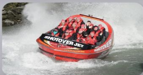
สนุกกับเรือShotover Jet