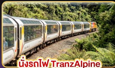
นั่งรถไฟTranzAlpine