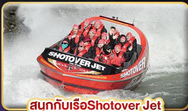
สนุกกับเรือShotover Jet