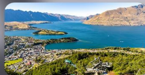
นั่ง Skyline สู Bob's Peak