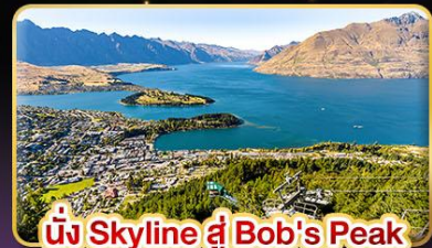
นั่ง Skyline ที่ Bob's Peak