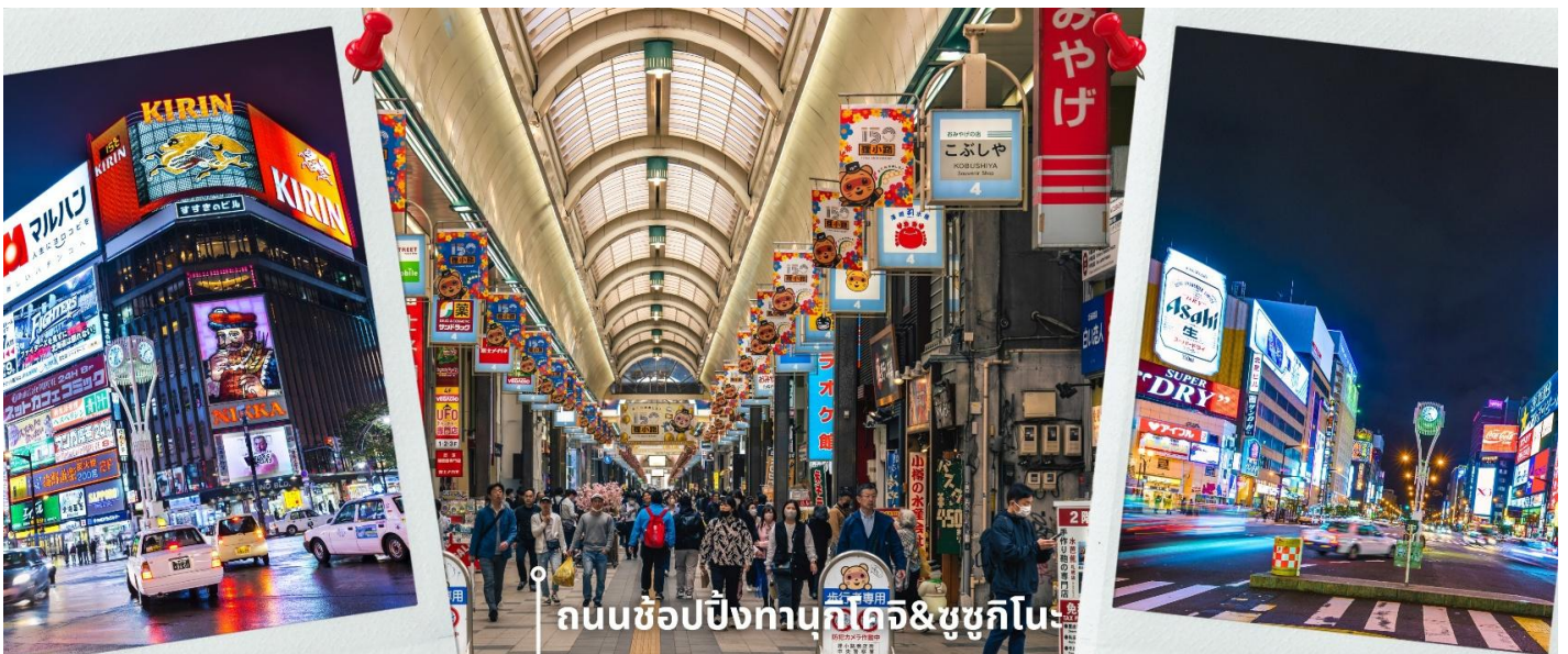
ถนนช้อปปิ้งทานุกิโคจิ&ซุซุกิโนะ

นอกจากนี้ด้านในยังมีช่วงที่ เปิดโอกาสให้ผู้เยี่ยมชมสามารถทำกล่องดนตรีของตัวเองได้ ทั้งเลือกรูปแบบและการเลือก เมโลดีเพลง เพื่อสร้างผลงานของตัวเองที่มีชิ้นเดียวในโลก และยังมีร้านค้าสำหรับขายกล่องดนตรีเพื่อซื้อเป็นของขวัญ ของที่ระลึกได้อีกด้วย พอสมควรแก่เวลาน่าท่านเดินทางสู่ ถนนช้อปปิ้งทานุกิโคจิ เป็นถนนช้อปปิ้งที่ตั้งอยู่แทบจะใจกลางเมือง Sapporo โดยมีร้านค้า ร้านอาหาร ห้างสรรพสินค้า ร้านเกม และโรงแรม รวมกันมากกว่า 200 เรียงรายยาว ตั้งแต่ทิศตะวันตก ยันทิศตะวันออกยาวถึง 1 กิโลเมตร และยังมีบันไดเลื่อนลงไปทางเดินใต้ดินอีกด้วย ซึ่งทางเดินใต้ดิน ก็ยังมีร้านค้า ร้านอาหารอีกมากมายด้วยเช่นกัน ถนนช้อปปิ้งแห่งนี้เป็นที่ที่มีหลังคาแทบจะตลอดทาง ดังนั้นแล้วไม่ว่าจะฝน ตก หิมะตก หรือแดดแรง ก็ยังสามารถเดินช้อปปิ้งที่ถนนแห่งนี้ได้เหมือนเดิม และย่านซุซุกิโนะ เป็นย่านช้อปปิ้งและบันเทิงที่ใหญ่ที่สุดในซัปโปโร ตั้งอยู่ใจกลางเมืองและตั้งอยู่บริเวณรอบๆสถานีรถไฟใต้ดินซุซุกิโนะ อยู่ถัดไปไม่กี่ไกลจาก สวนสาธารณะโอโดริประมาณ 500เมตรและอยู่ไม่กี่ไกลจากถนนทานุกิโคจิ ย่านนี้เป็นที่นิยมของทุกคนท้องถิ่นและนักท่องเที่ยว ย่านนี้เต็มไปด้วยร้านค้ามากมาย ทั้งสินค้าแฟชั่น สินค้าแบรนด์เนม ของฝาก ของที่ระลึก และสินค้าอุปโภค บริโภคต่างๆ รวมถึงสถานบันเทิงยามค่ำคืน ให้เวลาท่านได้อิสระเดินช้อปปิ้ง