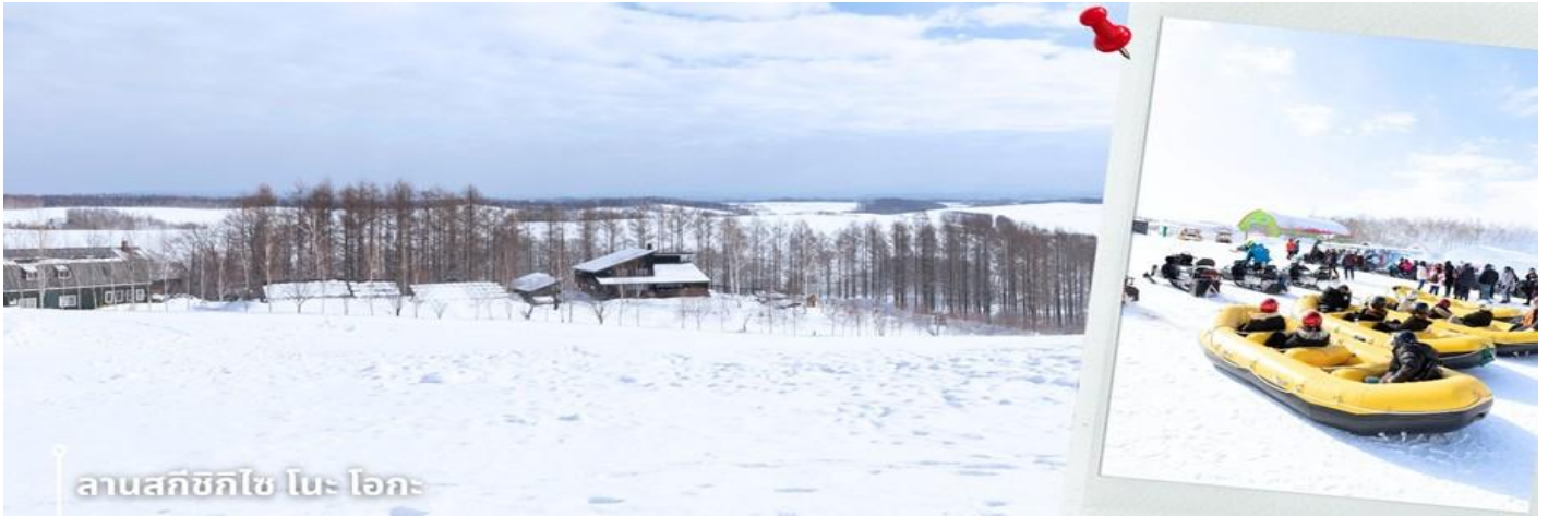
ลานสกีซิลโซ โนะ โอคะ