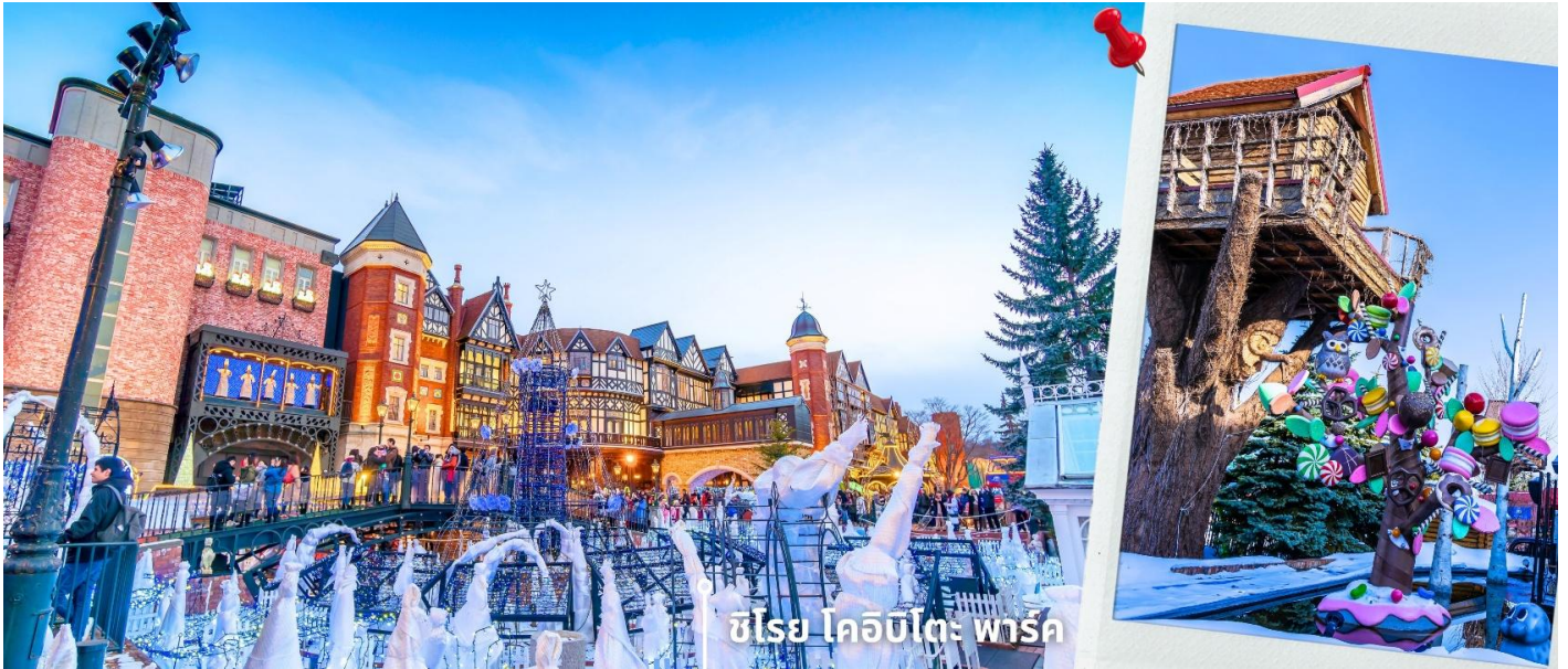
ชิโรย โคอิบิโตะ พาร์ค

นำท่านเดินทางสู่ DUTY FREE ให้ท่านได้ช้อปปิ้งสินค้าปลอดภาษี เครื่องสำอาง ของใช้ก่อนจะพาท่านเดินทางไปยัง ชิโรย โคอิบิโตะ พาร์ค เป็นโรงงานช็อคโกแลตชิโรย โคอิบิโตะ ตั้งอยู่ที่ เมืองซัปโปโร จังหวัดฮอกไกโด ประเทศญี่ปุ่น (ชมบริเวณด้านนอก) สวนชิโรย โคอิบิโตะ เป็นสถานที่ท่องเที่ยวที่ผสมผสานระหว่างโรงงานผลิตขนมและสวนสไตล์ยุโรป ก่อตั้งโดยบริษัท Ishiya ผู้ผลิตคุกกี้ชื่อดัง "Shiroi Koibito" ที่เป็นของฝากขึ้นชื่อของฮอกไกโด นอกจากนี้ที่นี่ยังมีพื้นที่กลางแจ้ง ที่ตกแต่งด้วยสถาปัตยกรรมสไตล์ยุโรป ทั้งสวนดอกไม้ และไฟประดับ โดยเฉพาะในฤดูหนาวที่ยังสร้างบรรยากาศโรแมนติกราวกับอยู่ในนิทาน เหมาะสำหรับนักท่องเที่ยวทุกเพศทุกวัย โดยเฉพาะผู้ที่สนใจในขนมหวานของญี่ปุ่น ให้ท่านจะได้เก็บภาพความสวยงามและเดินชมสวนตามอัธยาศัย