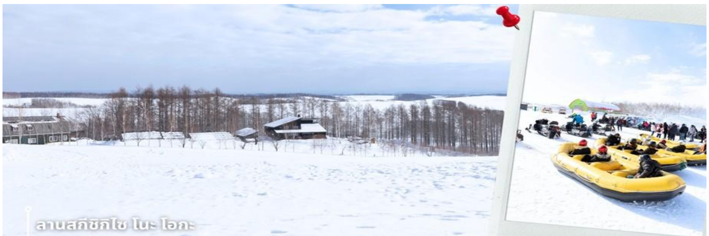
ลานสกีซึกิไซ โนะ โอะกะ