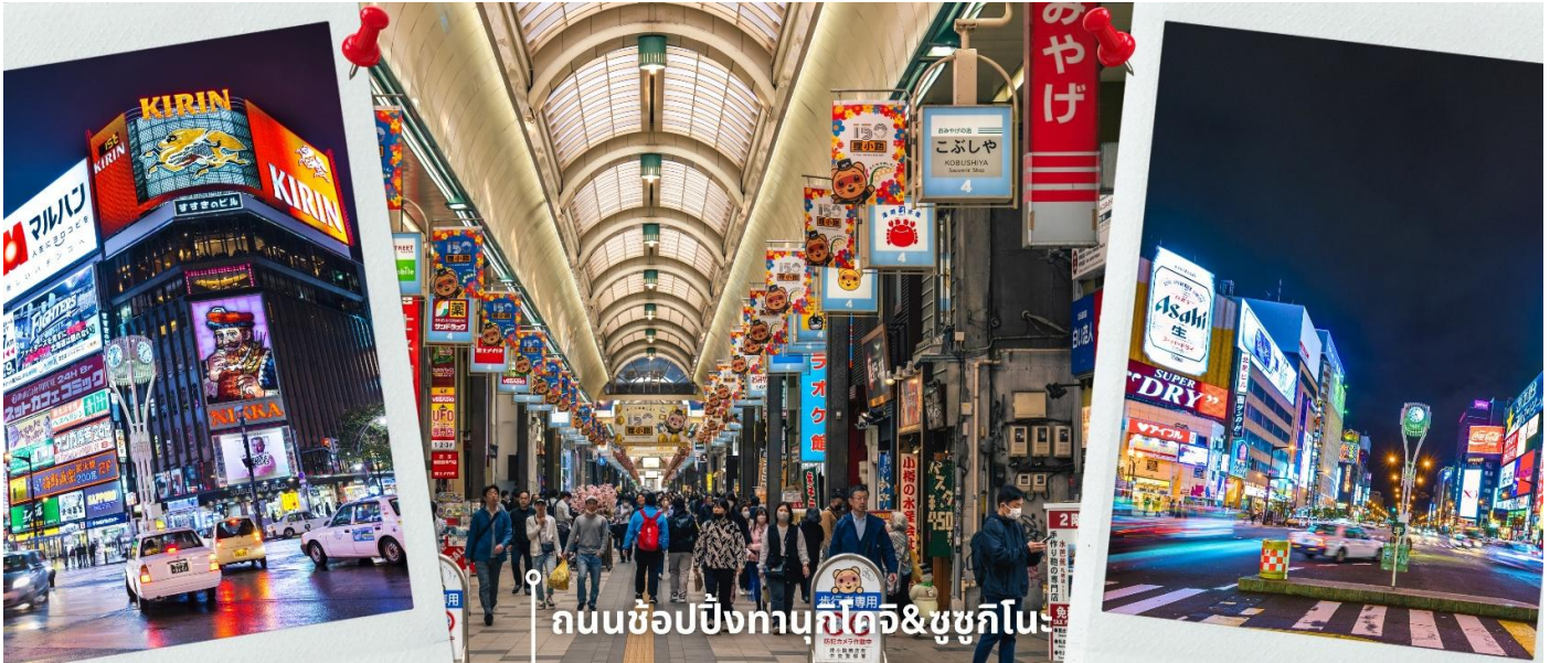
ถนนช้อปปิ้งนูกิโคจิ&ชูชิกิโนะ