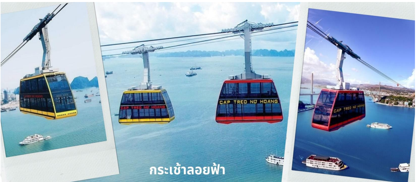
กระเช้าลอยฟ้า

จากนั้นนำท่านนั่ง Queen Cable Car กระเช้าลอยฟ้า 2 ชั้นที่ใหญ่ที่สุดในโลก จุนได้มากถึง 250 คนต่อเที่ยว สามารถรับ-ส่งผู้โดยสารได้มากถึง 2,000 คนต่อชั่วโมง กระเช้าลอยฟ้า 2 ชั้นยิ่งใหญ่อลังการนี้เป็นส่วนหนึ่งของ สวนสนุก Sun World Halong Park สร้างโดย Doppelmayr/Garaventa Group จากประเทศสวิตเซอร์แลนด์และออสเตรีย โดยมีความพิเศษที่สามารถทำลายสถิติโลก และได้รับการบันทึกลงใน Guinness World Records ถึง 2 รายการ คือ เป็นกระเช้าที่จุนได้มากที่สุดในโลก และมีเสาคอนกรีตส่งกระเช้าที่สูงที่สุดในโลก ด้วยความสูงถึง 188.88 เมตร