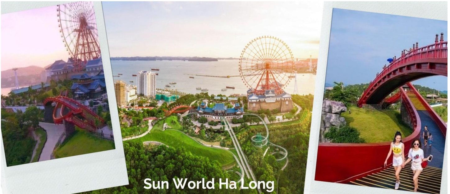
Sun World Ha Long

นำท่านเข้า สวนสนุกฮาลองพาร์ค (Sun World Halong Park) เป็นแหล่งท่องเที่ยวที่น่าสนใจแห่งหนึ่งของประเทศเวียดนามทางตอนเหนือ สร้างขึ้นโดย Sun Group ซึ่งเป็นโครงการใหญ่ในระดับภาคพื้นทวีป สวนสนุกแห่งนี้ได้แบ่งพื้นที่ออกเป็น 2 ฝั่งด้วยกันนั่นก็คือ Beach Amusement complex และ Mystic Mountain complex ซึ่งจะเชื่อมต่อกันด้วยกระเช้า Queen Cable Car สิ่งที่เราจะมาลองดูสักครั้งหนึ่งในชีวิตเมื่อมาเยือนที่นี่ก็คือ การนั่งชิงช้าสวรรค์ Sun Wheel ไปชมสวนญี่ปุ่น นั่งชมวิวนกระเช้า Queen Cable Car และเล่นที่สวนน้ำ Typhoon Water