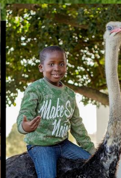
พารินทกรระจอกเทศ