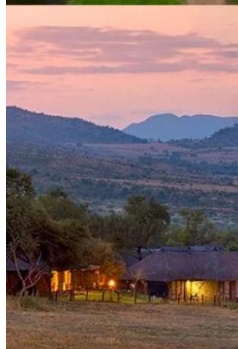
พัก SAFARI LODGE