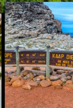
Cape good hope