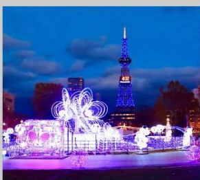
"SAPPORO WHITE ILLUMINATION"