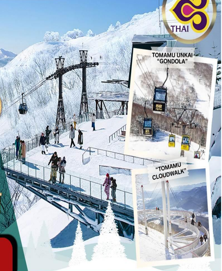
TOMAMU UNKAI "GONDOLA"