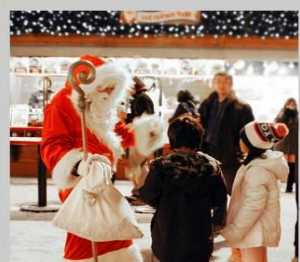
"ODORI GERMAN MARKET"