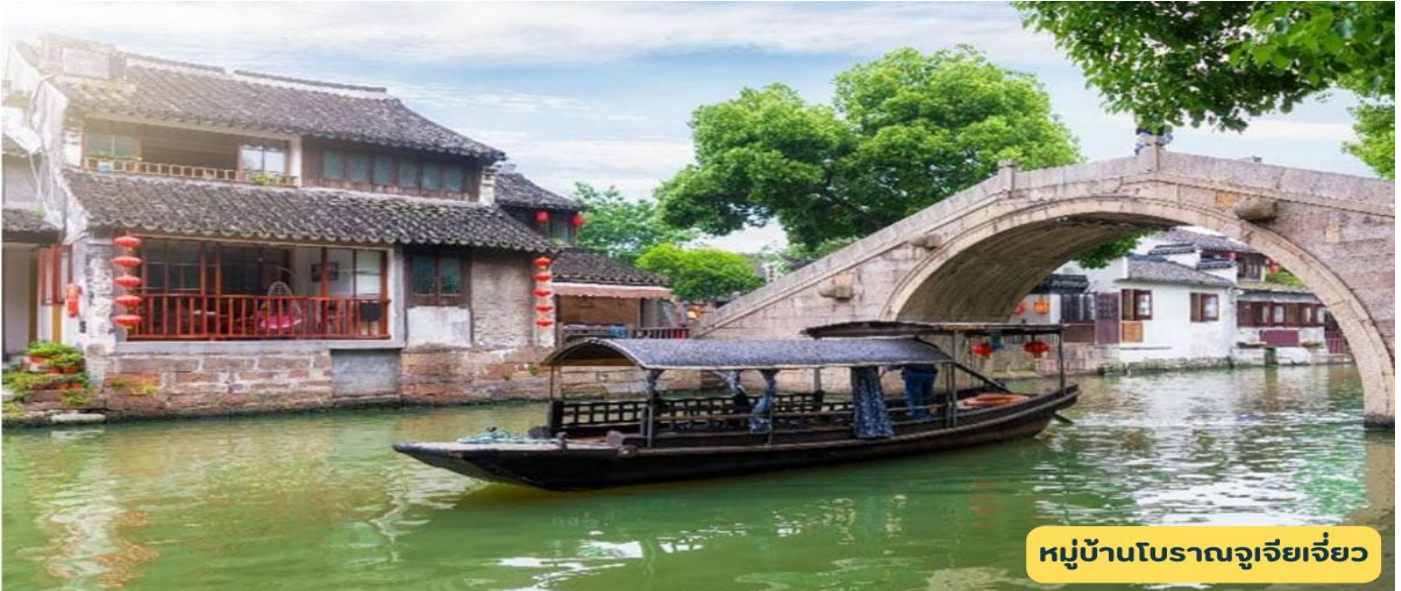
หมู่บ้านโบราณจูเจียเจียว

ล่องเรือหมู่บ้านโบราณจูเจียเจียว - ผานหลงเทียนตี้ - ซินเทียนตี้