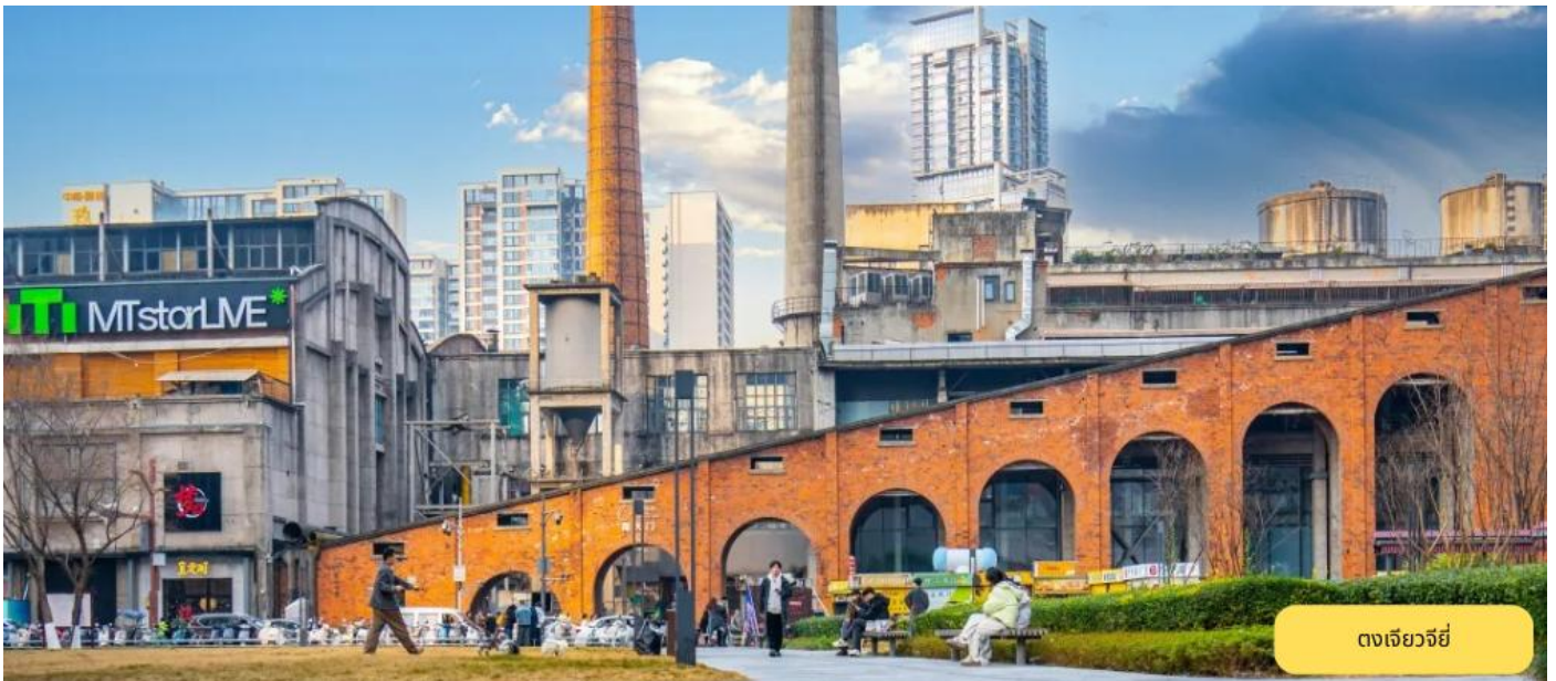
ดงเจียวจี้

ช้อปปิ้งดงเจียวจี้ - สวนสนามบินเจ็ดตุ - กรุงเทพฯ (สุวรรณภูมิ) TG619 15.55 – 18.00 น.