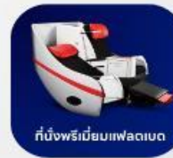
ที่นั่งพรีเมียมเฟลทเบด