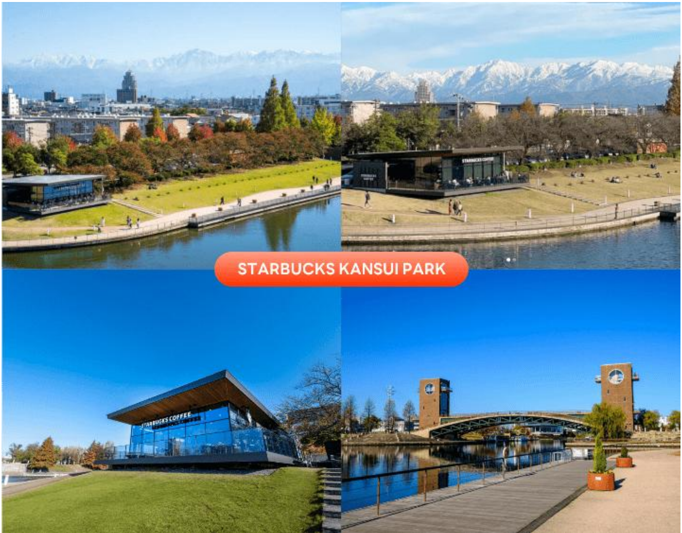
STARBUCKS KANSUI PARK

จากนั้นนำท่านสู่ Starbucks Kansui Park ร้านกาแฟดีไซน์ระดับไอคอนิกที่เคยได้รับการยกย่อง และโหวตให้เป็นสาขาที่สวยงามที่สุดในโลก ตั้งอยู่โดดเด่นริมผิวน้ำภายในสวนสาธารณะคันซุย สวนริมน้ำขนาดใหญ่ที่เป็นปอด และแลนด์มาร์กสำคัญของเมือง ตัวร้านได้รับการออกแบบด้วยกระจกใสบานใหญ่รอบทิศทางในสไตล์มินิมอล กลมกลืนไปกับธรรมชาติรอบตัวอย่างลงตัว ทำให้ไม่ว่าจะนั่งจิบกาแฟของร้าน ก็สามารถทอดสายตาดูวิวทิวทัศน์เพลิน ๆ หรือถ่ายรูปเป็นที่ระลึกกับวิวอันงดงามของสะพานข้ามคลอง Tenmon-kyo และผิวน้ำสีครามได้อย่างเต็มตาแบบไม่มีอะไรกั้น ถือเป็นไฮไลท์เด็ดที่ห้ามพลาด (ราคาทัวร์ไม่รวมค่าเครื่องดื่ม) (การเปลี่ยนสีของใบไม้ ขึ้นอยู่กับสภาพอากาศเป็นสำคัญ)