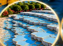
ปามุกคาล์