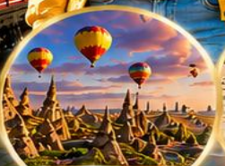
เมืองคัปปาโดเกีย