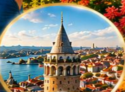
หอคอยกาลาตา