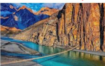
สะพานแขวนฮุสไซนี

DAY6 สะพานแขวนฮุสไซนี-กิลกิต-พระพุทธรูปคาร์กาห์