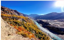
ป้อมปราการ Altit Fort

DAY4 ป้อมปราการอัลติท-ตลาดพื้นเมือง-ฮอปเปอร์ กลาเซียร์ -หุบเขาคูดเกอร์