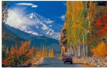
เมืองชิลาส

** พักที่ Shangrila Chilas Hotel หรือเทียบเท่า **