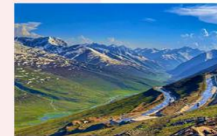
หุบเขา Naran Kaghan

** พักที่ Besham Hilton Hotel หรือเทียบเท่า **