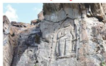
พระพุทธรูปคาร์กาห์

** พักที่ Kallisto Hotel หรือเทียบเท่า **