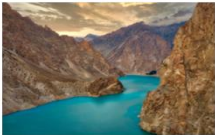
ทะเลสาบอิตตาบัด