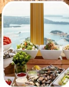
SKYFEAST BUFFET SYDNEY TOWER