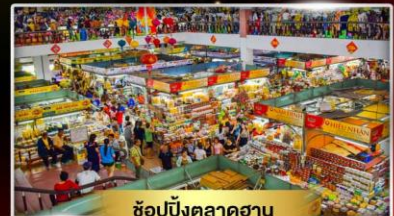
ช้อปปิ้งตลาดฮาน