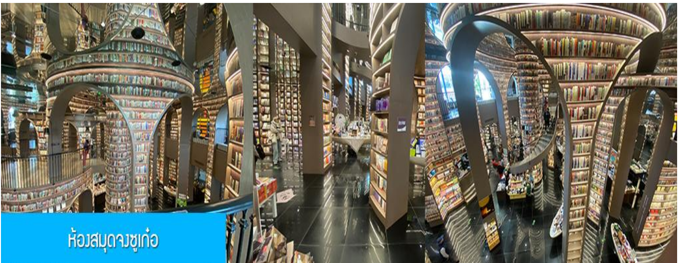
ห้องสมุดวงซูเก้อ

รับจัดกรุ๊ปเหมา ท่องเที่ยว สัมมนา ดูนาน ต่างประเทศทั่วโลก