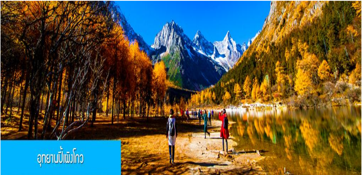
อุทยานπίงโกว