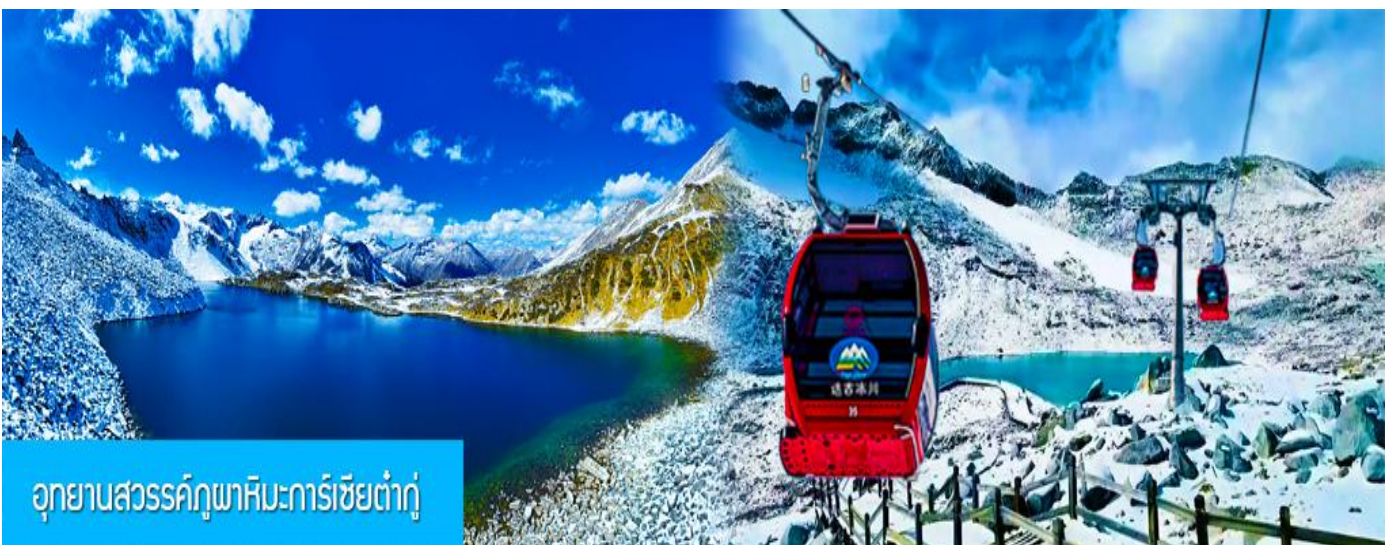
อุทยานสวรรค์ภูพาหิมะการ์เซียต้ากู่

พักที่ โรงแรม DAGU GLACIER HOTEL ระดับ 4 ดาวห้องหินหรือเทียบเท่าใกล้อุทยานต้ากู่