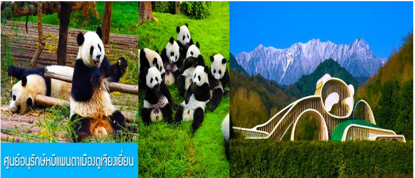
ศูนย์อนุรักษ์หมีแพนดามืองดูเจียงเยียน