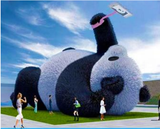
ตุ๊กตาแพนด้าอนเซลฟี