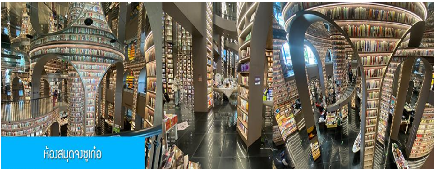
ห้องสมุดวงซูก่อ