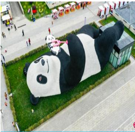
ตุ๊กตาหมีแพนดาเซลฟี

รับประทานอาหารกลางวัน ณ ร้านอาหารพื้นเมือง (8)