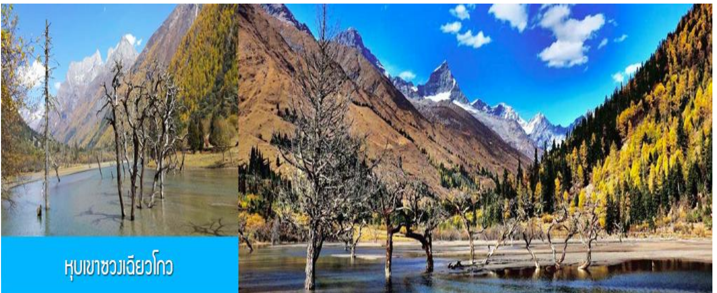
หุบเขาขวงเจียวโกว

รับจัดกรุ๊ปเหมา ท่องเที่ยว สัมมนา ดูนาน ต่างประเทศทั่วโลก