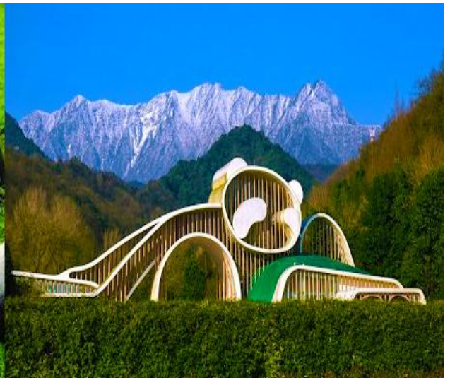
ศูนย์อนุรักษ์หมีแพนด้าเมืองดูเจียงเยียน

รับจัดกรุ๊ปเหมา ท่องเที่ยว สัมมนา ดูนาน ต่างประเทศทั่วโลก