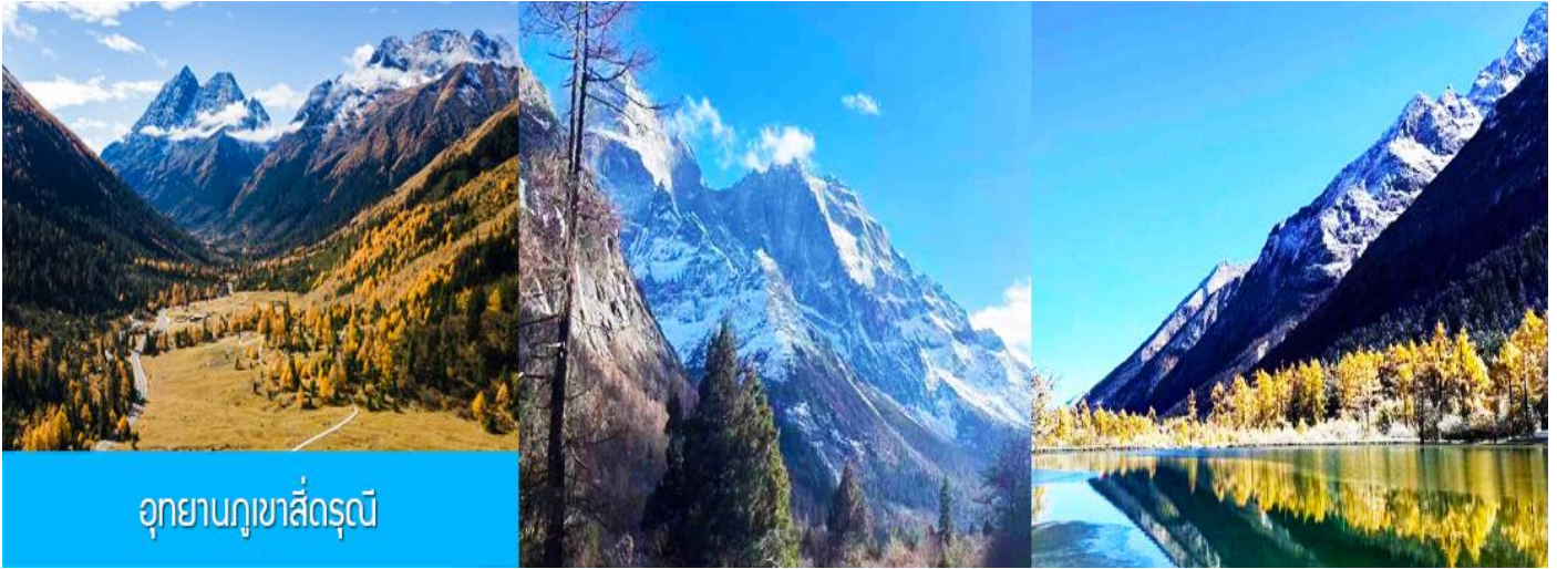
อุทยานภูเขาสีดรุณี