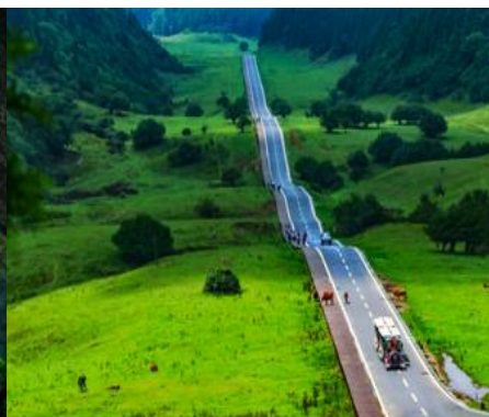
อุทยานเขาเนวฟ้า