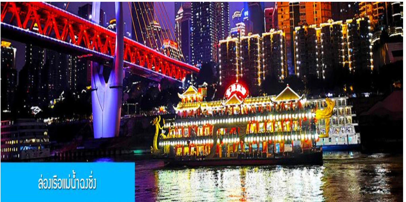
ล่องเรือแม่น้ำจางซี

รับจัดกรุ๊ปเหมา ท่องเที่ยว สัมมนา ดูนาน ต่างประเทศทั่วโลก