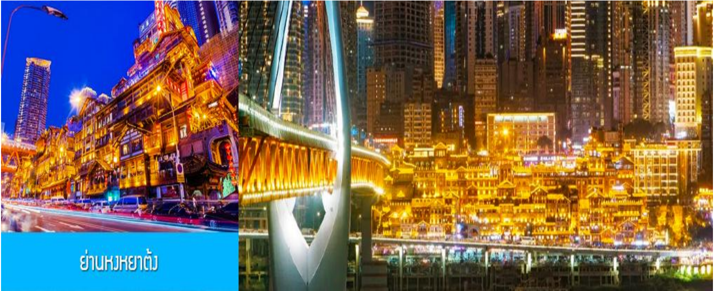
ย่านหงหยาดัง

เดินทางถึง สนามบินเจียงเป๋ย นครฉงชิ่ง ผ่านพิธีการตรวจคนเข้าเมืองและศุลกากร นำคณะเดินทาง โดยรถบัสส่วนตัวเมืองฉงชิ่ง..... นครฉงชิ่ง 重庆 เป็นหนึ่งในสี่มหานครที่มีฐานะเทียบเท่ามณฑล ตั้งอยู่ตอนบนของแม่น้ำแยงซีเกียง เป็นมหานครที่ใหญ่ที่สุดทางด้านทิศตะวันตกของจีน มีประชากรกว่า 32 ล้านคน นครฉงชิ่งยังมีสมญานามว่า เมืองภูเขา เมืองแม่น้ำ เมืองหมอก และเมืองสะพาน ฯลฯ