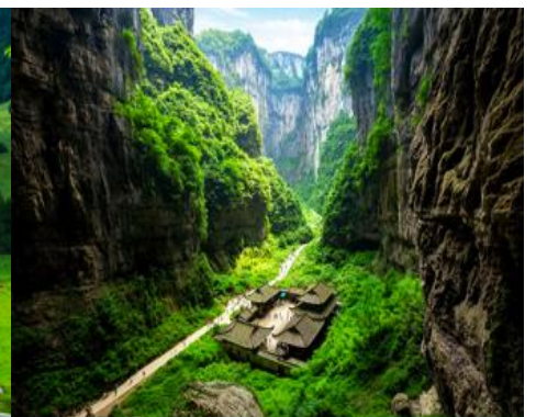
สะพานธรรมชาติสามแห่ง

รับจัดกรุ๊ปเหมา ท่องเที่ยว สัมมนา ดูนาน ต่างประเทศทั่วโลก