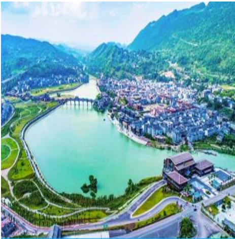
เมืองโบราณจั่วสู่ย