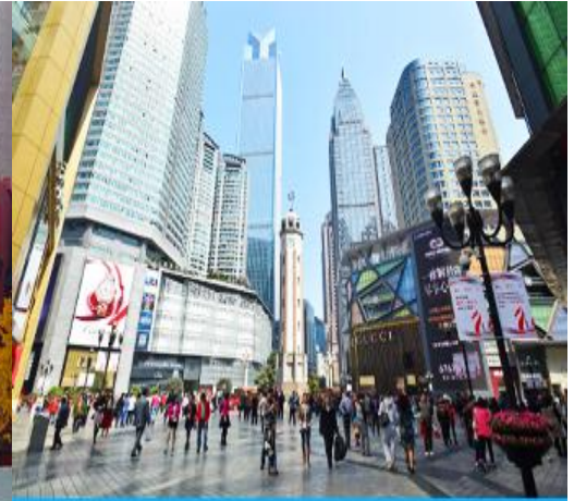
ย่านเจียฟ่างเปย

นำท่านเที่ยวชม หอศิลป์กั๋วไท่ 国泰艺术中心 (อาคารตะเกียบ) จุดเช็คอินใหม่ของมหานครฉงชิ่งที่ เต็มไปด้วยศิลปะและสถาปัตยกรรมจีนร่วมสมัย ที่โดดเด่นด้วยรูปทรงที่เก๋ไก๋ทันสมัยและสดุดา.... จากนั้นนำท่านเที่ยวชม ย่านเจียฟ่างเปย 解放碑 แหล่งช้อปปิ้งที่รวมเอาห้างสรรพสินค้า ร้านจำหน่าย สินค้า แบรินด์เนม ย่านถนนคนเดิน ร้านสตรีทฟู้ด ที่ตั้งอยู่ใจกลางเมืองฉงชิ่ง เป็นที่นิยมของบรรดา วัยรุ่นและนักท่องเที่ยว.....ให้ท่านมีเวลาอิสระเต็มที่กับการเดินช้อปปิ้ง