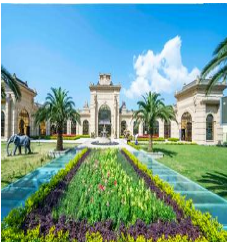
สวนแห่งความรักไอลิส

ชม สะพานลมฝน 风雨廊桥 ที่ใหญ่และสวยงามที่สุดในโลก เป็นสะพานไม้โบราณที่สร้างคร่อมแม่น้ำหรือบึงน้ำ จุดเด่นของสะพานคือมีหลังคาครอบคลุมตัวสะพาน จึงสามารถใช้กันฝนและแดดลมได้ ซึ่งเป็นที่มาของชื่อคำว่า สะพานลมฝน นิยมสร้างในเขตพื้นที่ที่เป็นที่พำนักของชนกลุ่มน้อยทางภาคตะวันตกเฉียงใต้ของจีน อาทิ ในมณฑลยูนนาน มณฑลกุ้ยโจว ฯลฯ