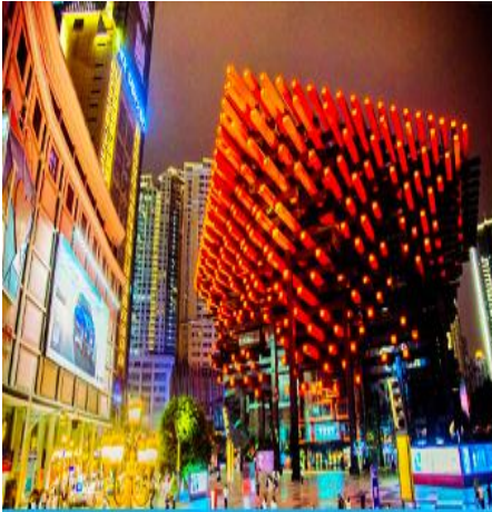
หอศิลป์กั๋วไท่