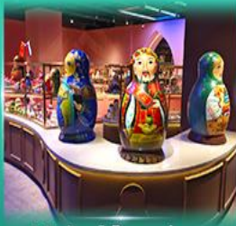
พิพิธภัณฑ์ ตุ๊กตาเปลูกุด