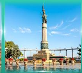
อนุสาวรีย์ชิงเฟิง

รับจัดกรุ๊ปเหมา ท่องเที่ยว สัมมนา ดูงาน ต่างประเทศทั่วโลก